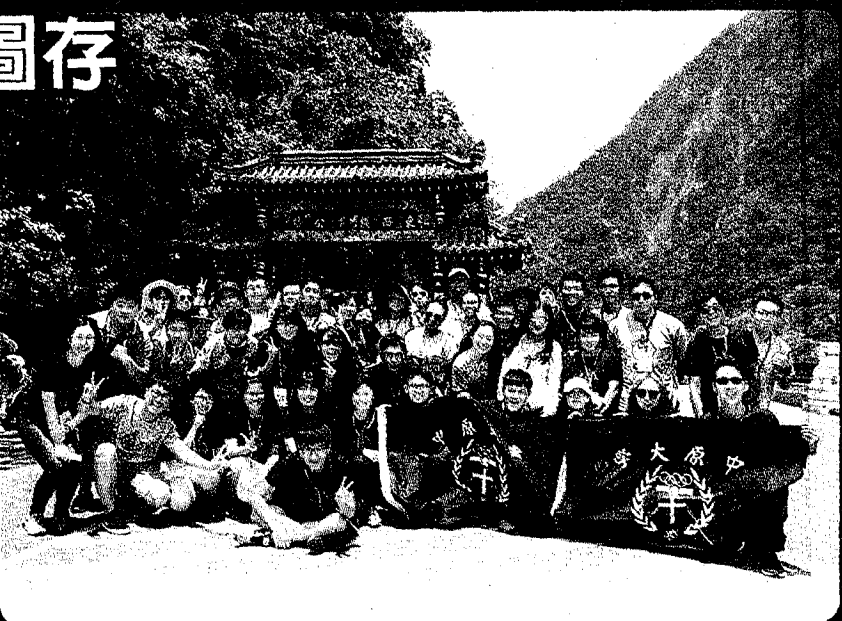
▲兩岸僵局持續不下，陸生來台短期就學人數逐年大幅減少。圖為中原大學暑期陸生實訓營，兩岸學子進行近1個月學術交流。

2016年政黨輪替後，陸生來台人數減少的消息不斷傳出，研修生也從2015年度的3萬2648人，減少至2016年度的2萬5824人，由於教育難與政治脫勾，蔡政府堅持台獨，不只傷及台灣民生及外交，台灣高教面臨少子化困境，國內生源逐漸減少，大學退場與併校立場模糊不清，新南向招生又存在語言、師資等諸多條件限制，根本無法彌補陸生市場缺口，從內而外的問題都無從解決，宛如置人民於水火而不顧。（李侑珊）