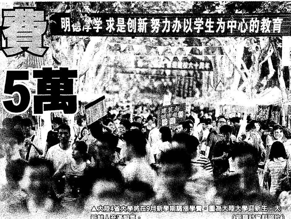
△大陸4省大學將在9月新學期調漲學費。圖為大陸大學迎新，大一新生人充滿朝氣。

伴隨物價增長、大學生均培養成本增加，安徽、河北、雲南及陝西4省近期宣布，將在9月新學期調漲學費，各省漲幅雖約略不一，但這波漲學費主力主要落在民辦學校，其中雲南漲幅最大，10所私校學費漲幅超過1成，其中以雲南師範大學商學院為例，該校藝術系調漲學費後，一年學費達2.98萬元（人民幣，下同），約新台幣13.5萬元。