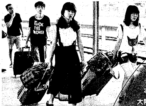
◀學生在瀋陽車站乘車，準備返校。（中新社資料照片）

以本次雲南的民辦大學學費上漲幅度來看，除部分學校的個別科系學費為一學年收費1.45萬元外，大多學費落在一學年1.6萬元至1.9萬元之間，其中以藝術類的學費最高，均打破一學年2萬元大關，而雲南師範大學商學院藝術系在調整後學費收費標準達到一年2.98萬元，住宿費用則另計。