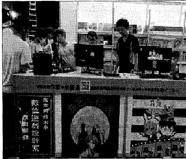
東南科大數位遊戲設計系初試啼聲。