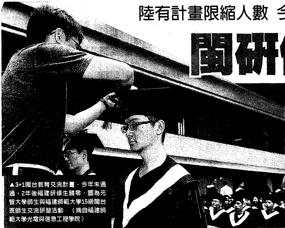
▲3+1閩台教育交流計畫，今年未通過，2年後福建研修生歸零。圖為元智大學師生與福建師範大學15級閩台班師生交流研習活動。

福建派送研修生來台，大多透過3+1閩台合作計畫，如今兩岸關係走向非正常化，陸方無意再釋出陸生生源，有中部大學主管透露，研修生來台交流，原則上是大一申請、大三來台，過程需兩年運作，但今年福建省教育廳未通過這項研修生方案，代表兩年後福建研修生來台人數「歸零」，無人來台。