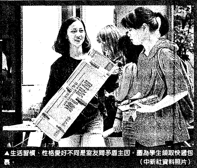
▲生活習慣、性格愛好不同是室友間矛盾主因。圖為學生領取快遞包裹。 (中新社資料照片)

另外溫州大學在2013年則啟用網上自選寢室系統，新生可以自選寢室和室友，學生在系統中填寫有無早起習慣、有無午睡習慣、個人衛生、興趣愛好、性格特點等資料後，在系統內公開，由其學生們相互選擇。