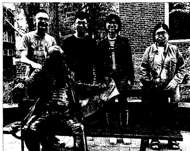
中金院學生與拿著畢業證書的創辦人Benjamin Franklin雕像合照。

公益為先、助弱扶優」為辦學理念，透過系統化實務教學，培養未來國際金融家。學生從大一開始就安排CEO級的業師授課，站在巨人肩膀上學習。