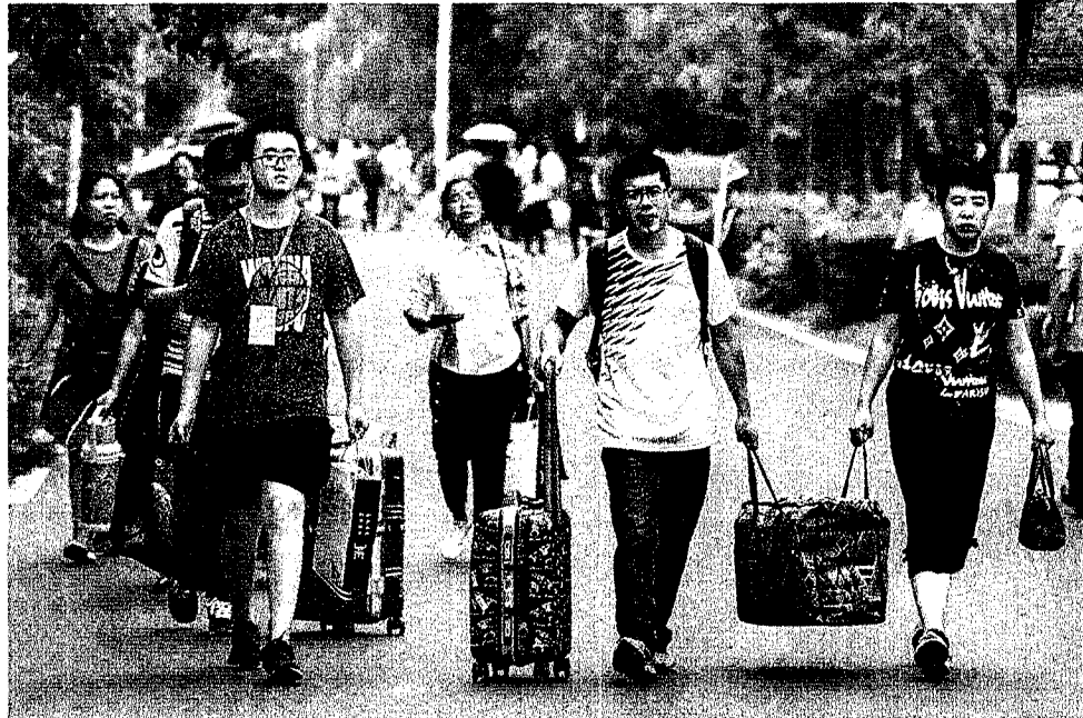
▲南京大學校園一隅。

8月初，南大對2018級新生進行問卷調查，內容包括了生活作息、個人衛生習慣、共用物品、消費傾向和興趣愛好等，具體選項包括，晚睡晚起還是早睡早