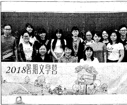
宜大暑期營-講師與學員合影。