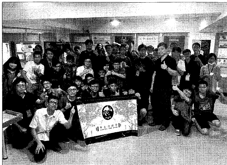
2018 LHU x Student Game Jam (SGJ, 學生遊戲黑客松), 於龍華科技大學盛大舉行。

【記者王志誠、周貞伶／綜合報導】2018 LHU x Student Game Jam (SGJ, 學生遊戲黑客松), 日前於龍華科技大學盛大