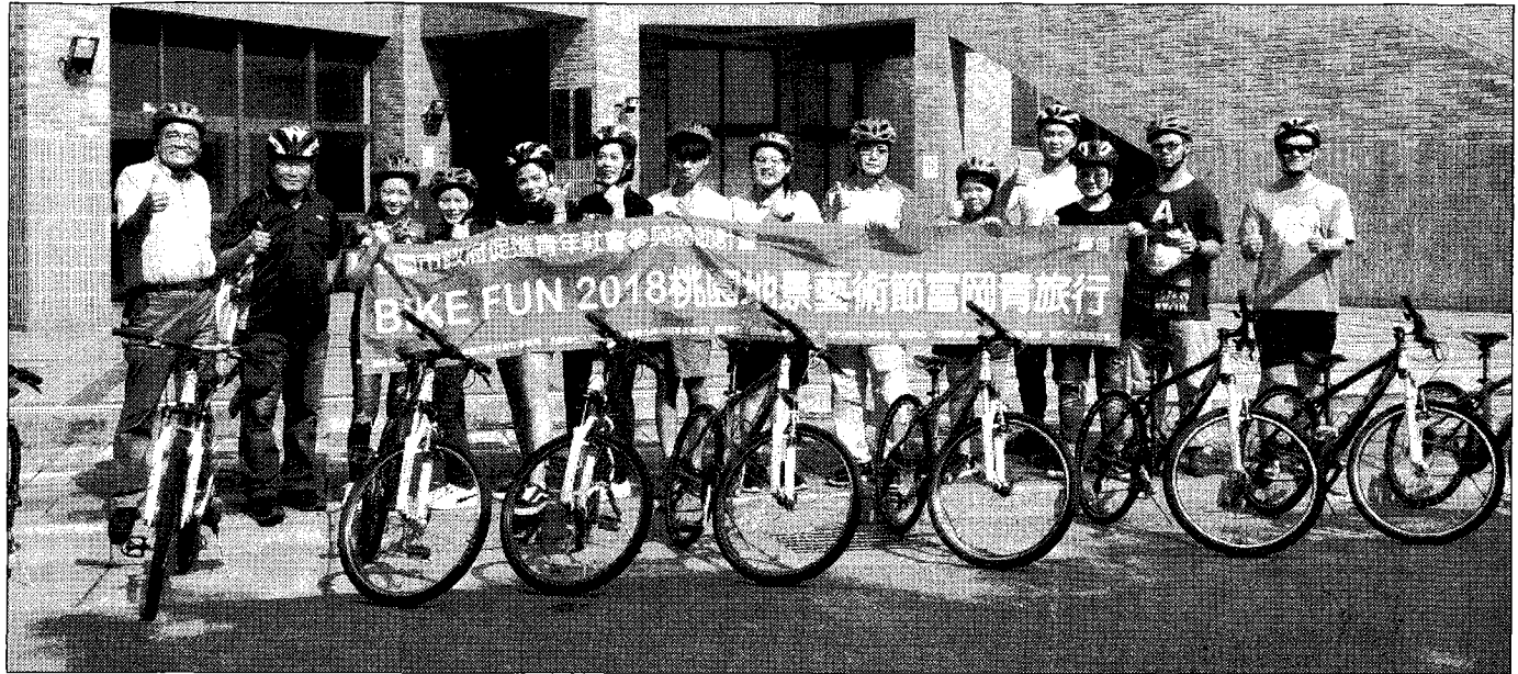
「BIKEFUN 2018桃園地景藝術節-富岡青旅行」領隊人員培訓。

【記者王志誠、周貞伶／綜合報導】近幾個月來，在社群媒體上頻頻出現了在桃園市楊梅區富岡里「白鷺鷥」造型熱門打卡的地景，桃園市政府將於2018年九月十四日至三十日爲期十七天在楊梅／富岡、中壢／老街溪、青塘園地區舉辦2018桃園地景藝術節，以「老城新藝·水young桃源」爲主題。沿續桃園地景藝術節的三大主軸「地方覺醒」、「社區風動」、「藝術打樁」，與四大價值「社區參與」、「在地特色」、「環境永