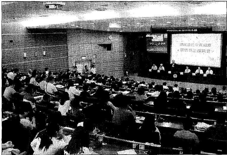
龍華科大舉辦關懷師生座談，讓新生與家長深入認識學校優勢與辦學特色，並熟悉校園學習環境。