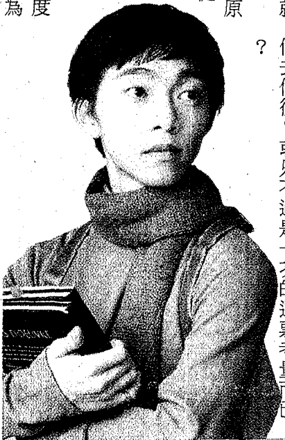
自由時報 A14 版

該項專款，依勞基法必須為工讀生保勞健保。首開惡例的就是台師大，以「學習型助理」規避勞基法，國立大學已然如此，私立大學更加嚴重，除了逃繳勞健保費，也利用服務學習來剝削學生。 大家都說教育主體是學生，但是學生權益究竟何在？都說教育是國家百年大計，但是台灣百年教育藍圖何在？那些御用學者或馬屁官員的阿諛奉承，以各種虛偽造假的漂亮數據扼殺了學生受教權益，才是台灣高等教育現況。值此新教育部長上任履職之際，我們想請問蔡英文總統：台灣高等教育究竟該何去何從？或只不過是一次的選票考量而已？