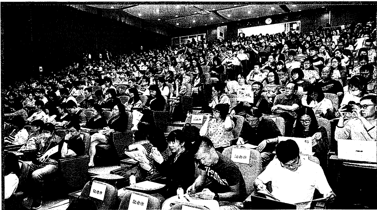
國教行動聯盟等教育團體昨天在台北舉行「大學入學制度一〇八學年度新措施座談會」，數百名家長湧進會場，聽取教育官員及學者專家等說明新制。(中央社)

〔中央社台北訊〕教育團體昨天表示，今年大學申請入學曾發生輔大醫學系招不到學生的窘境，且近一成學測滿級分考生落榜，凸顯申請入學的賭局亂象，造成家長學生焦慮，必須妥慎處理。