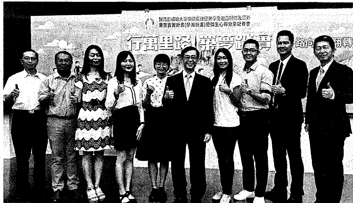
教育部計畫未來3年內，每年送出一萬名大學生出國研修。右五為教育部政次姚立德。

雖然中國打壓我外交空間，但教育部推動學海計畫十二年，迄今已送三萬多名大學生出國學習，變身為青年大使，將台灣的活力和友善傳遞給各國人民；教育部政次姚立德昨表示，未來三年，將加碼每年編列七一億元，盼三年內達成每年送出一萬名大學生出國研修的目標，讓世界看見台灣。