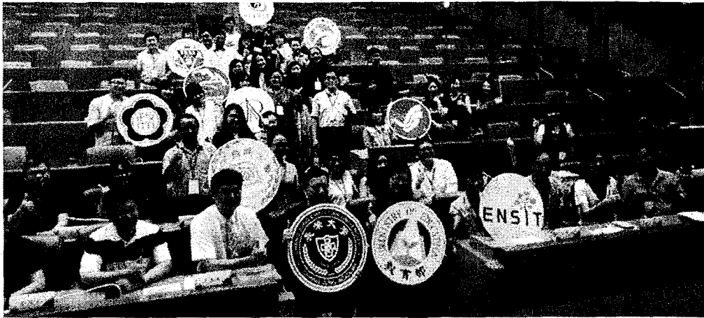
「智慧生活整合性人才培育特色大學計畫」在長榮大學登場。

【本報記者黃緒勳台南報導】教育部資科司推動「智慧生活整合性人才培育特色大學計畫」，史馬特巡迴列車長榮大學站昨日盛大開幕，以「智慧農業在長大，科技創新迎未來」為主題的系列巡迴展活動，呈現長榮大學深耕在地成果。