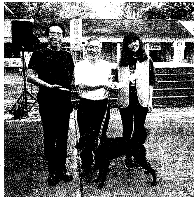
民眾日報（1版） 橫山藝術祭活動。

國防部後備指揮部高雄市後備指揮部國軍人才招募中心、高雄市政府都市發展局、社會局、教育局、農業局、燕巢區公所、燕巢區農會、高雄市援剿人文協會、燕巢各社區發展協會；高雄學園的高雄科大、高雄師大、高雄大學、義守大學、義大醫院與義大醫學院；燕巢國中、燕巢國小及尖山分校、橫山國小、金山國小、安招國小、鳳雄國小；產企業界的青葉油漆、高健鏽射精機公司、福樂多醫療福祉事業、統一超商、綠色冀泉社會企業等單位更是傾全力協助。