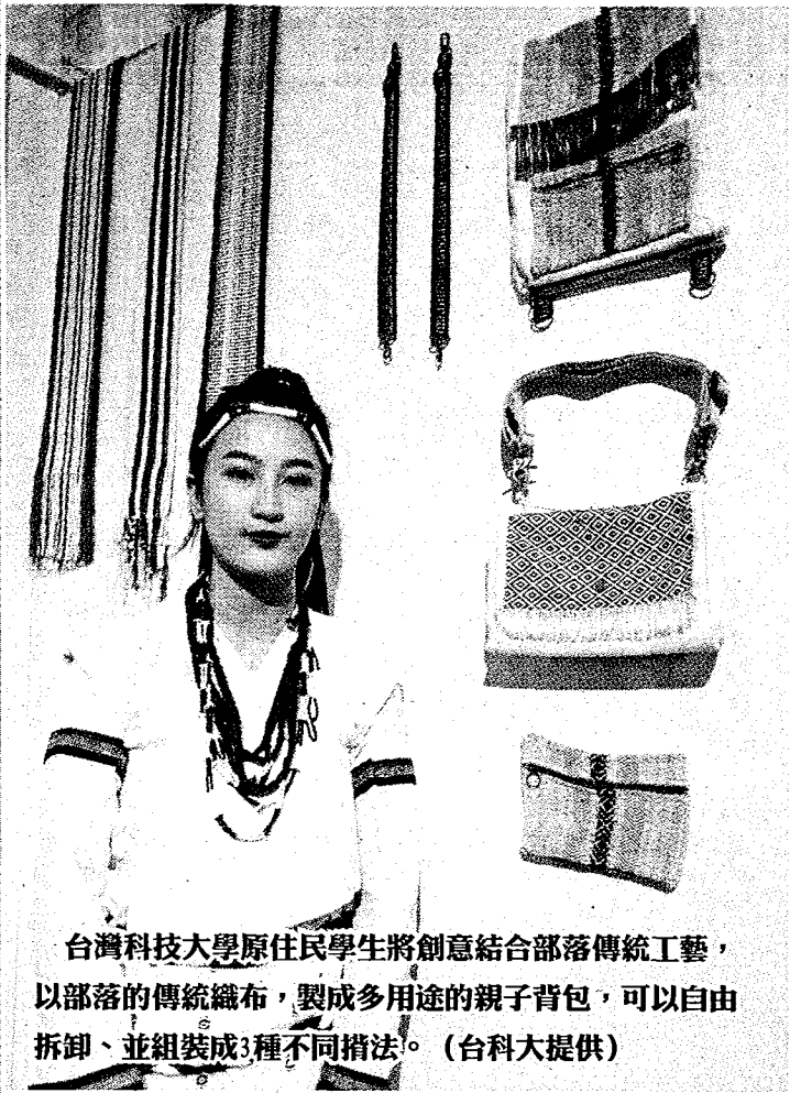
台灣科技大學原住民學生將創意結合部落傳統工藝，以部落的傳統織布，製成多用途的親子背包，可以自由拆卸、並組裝成3種不同摺法。

台科大校長廖慶榮表示，台科大學生實作能力強，喜歡動手做，也有豐富的設計能量，學生們透過實際探訪部落，不僅學會珍貴的傳統原住民工藝技術，更發揮專長打造實用又具設計感的作品，是很難得的學習體驗，也讓部落工藝有了不一樣的創新想法與活力。