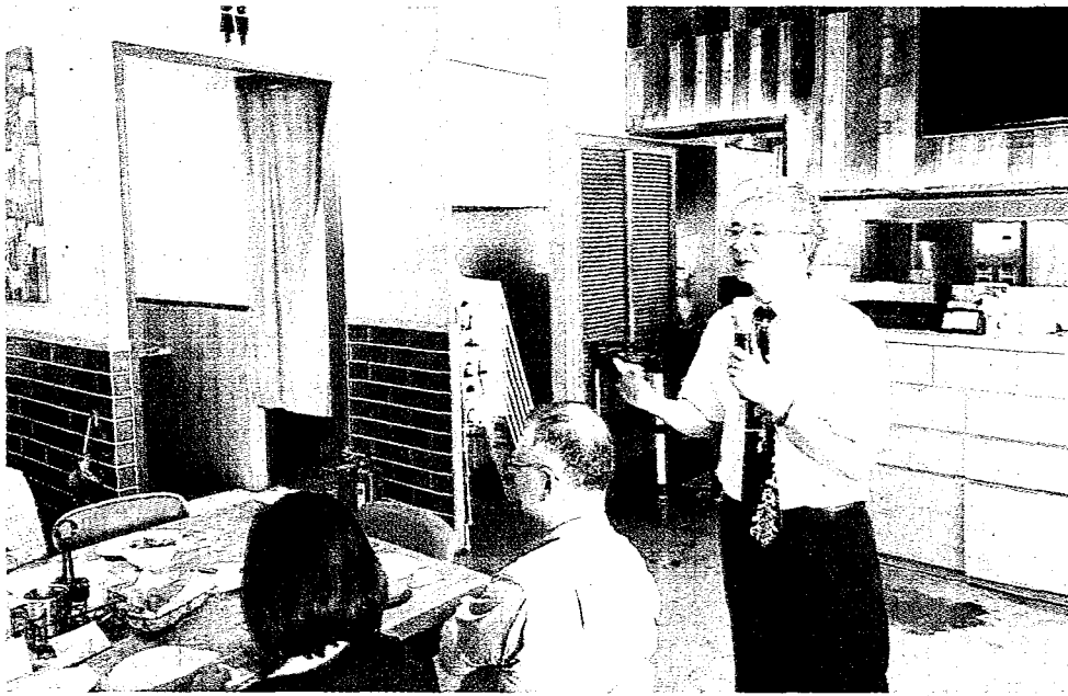
臺師大校長吳正己表示，這學期開始教育學院下設「學習資訊專業學院」，理學院下設「生命科學專業學院」兩個院級專業學院。