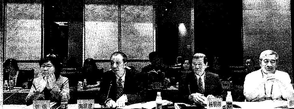
◀2018海峽科技論壇之教育合作分論壇20日在海口召開，大陸教育部港澳台辦主任劉錦（左）在會中表示，大陸鼓勵台灣學生到大陸念大學，並在錄取標準、獎學金及就業輔導上，特別優待台生。（記者宋秉忠攝）