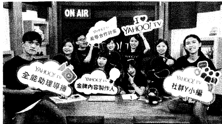
● Yahoo TV第二屆產學合作計畫宣布擴大規模，攜手六大院校進行實習計畫。圖為六校實習生代表。