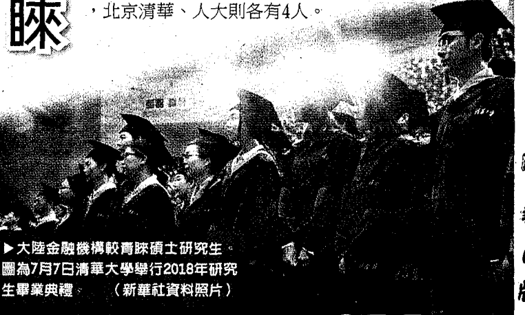
大陸金融機構較青睞碩士研究生。圖為7月7日清華大學舉行2018年研究生畢業典禮。