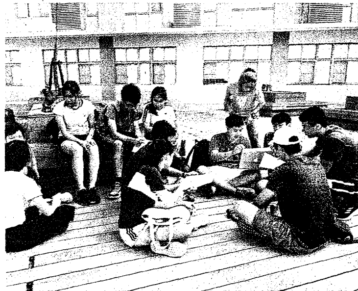
交通大學「百川學士學位學程」最近正式入學，首屆錄取17人，學生於課後討論。