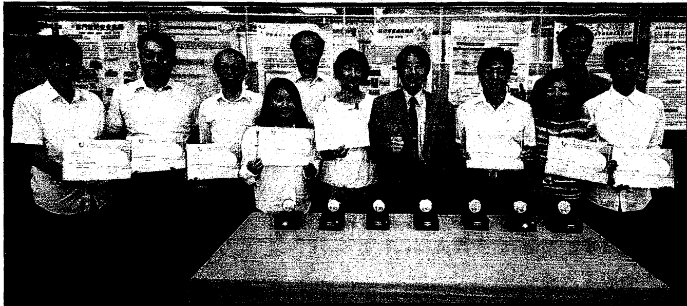
創新技術博覽會，嘉藥Seven Up！

榮獲2金3銀2銅佳績 更創下「Seven Up」 校長期許將創新專利技轉為商品 推廣學研成果