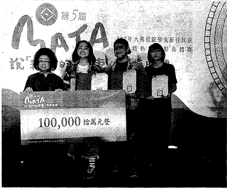
圖：「海子Micelemay」獲選非紀錄片類首獎。

記者葉文杰／報導 教育部與原住民族委員會為鼓勵大專校院學生以原住民族文化進行數位創作，主辦「MATA獎」並於昨日舉行頒獎典禮。國立東華大學民族語言與傳播學系以「海子Micelemay」及「血染太魯閣」，分別奪得非紀錄片類及紀