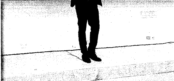
台北城市科技大學聘請藝人謝祖武出任事業演藝學 程系主任。