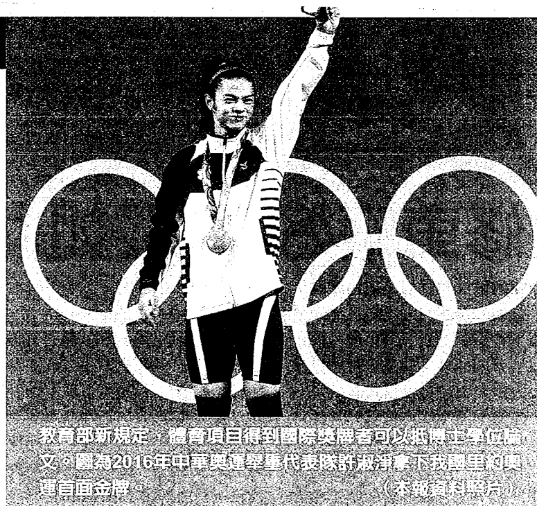
教育部新規定，體育項目得到國際獎牌者可以抵博士學位論文。圖為2016年中華奧運擊擊代表隊許淑淨奪下我國里約奧運自由金牌。

另外，授予學位名稱未來擬由學校自訂！教育部表示，為因應國際潮流、科技資訊及新興學科快速發展，研擬鬆綁授予學位名稱得由學校依學生所修讀學術領域、課程要件而訂定，提教務相關校級會議通過後實施；惟為避免學位授予浮濫，仍須報教育部備查。