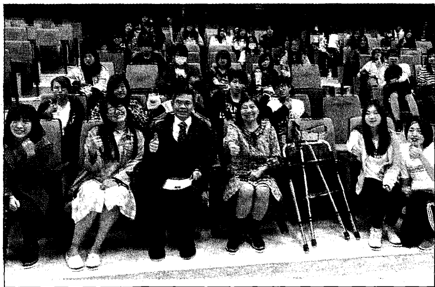
台南應用科大汪汪哈狗社成立七年，已照顧治療及送養進入校園流浪犬三十餘隻。

同時，宣導領養不棄養之動保理念，以寓教於樂的方式，增進學生救助流浪犬知能及照顧校園及社區TNR犬技能，培養尊重生命及社會關懷涵養。