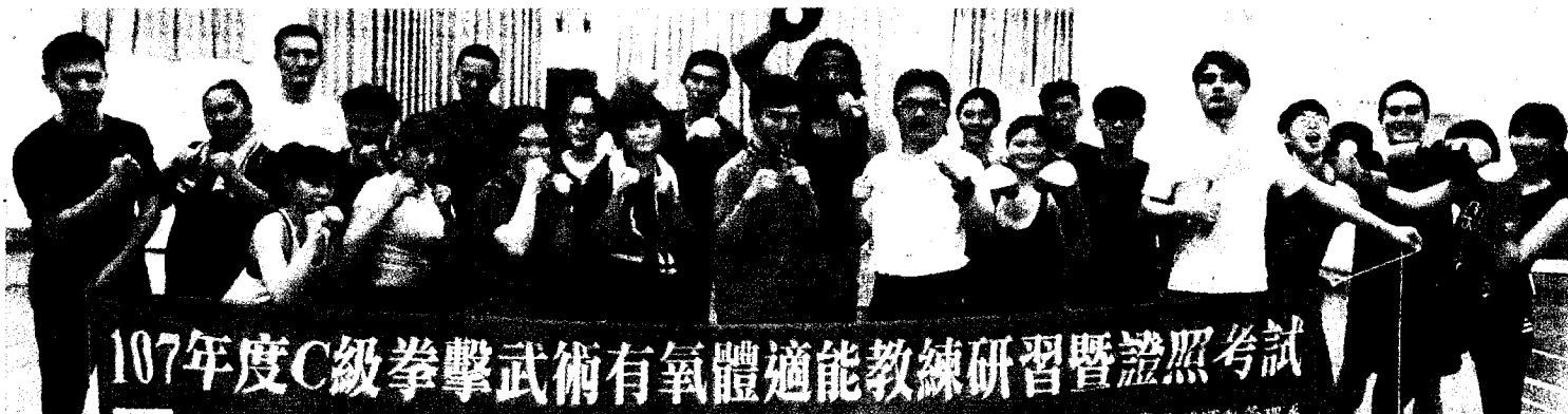
高苑科技大學舉辦C級拳擊武術有氧體適能教練研習活動。