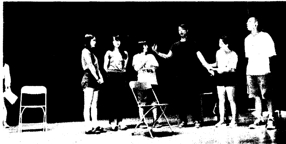
南華大學外文系畢業公演，魔法褸母麥克菲登場。

該劇將藉由童話故事，讓觀眾看到「愛」如何使人良善和成長的正面能量，同時也點出親子溝通及如何教育孩子的議題，嚴苛與溺愛過猶不及。劇中魔法褸母為了培養孩子們自律的精神，要求他們準時上床睡覺、準時起床、準時換好衣服；為了培養他們感恩的胸懷，她要孩子們隨時說請及謝謝；為了培養孩子們成為負責任的人，孩子就算犯錯，也要想辦法自己解決。此劇，不僅能帶給孩童教育寓意，從小培養良好的品德，相信身為父母者也會有所啟發，並且能瞭解到親子之間要學會互信與尊重的重要性，更要真心聆聽彼此的心聲。