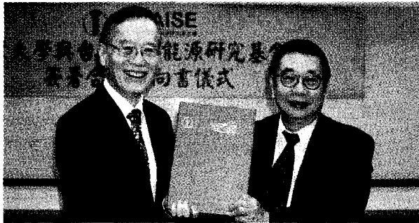
●大葉大學與財團法人台灣永續能源研究基金會簽署合作。

研發與環境教育，可說是高等教育綠色發展的先驅。永續包含經濟、社會、環保三大面向，基金會長期關注永續能源、綠色經濟、低碳經濟、氣候變遷、企業永續發展等議題，未來雙方可結合過去推動永續發展的經驗，透過企業永續培訓課程、大學講堂、國際研討會等推廣活動，傳播永續教育知識。