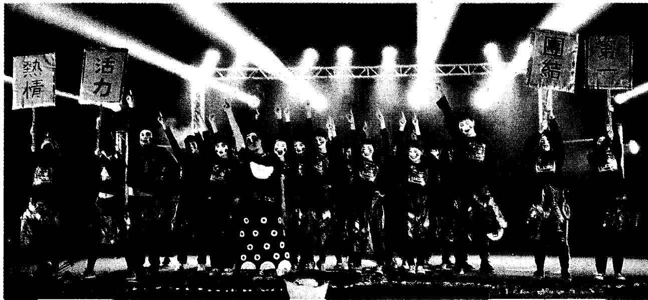
崑山科大唱跳大賽，時尚學程華麗走秀奪冠！