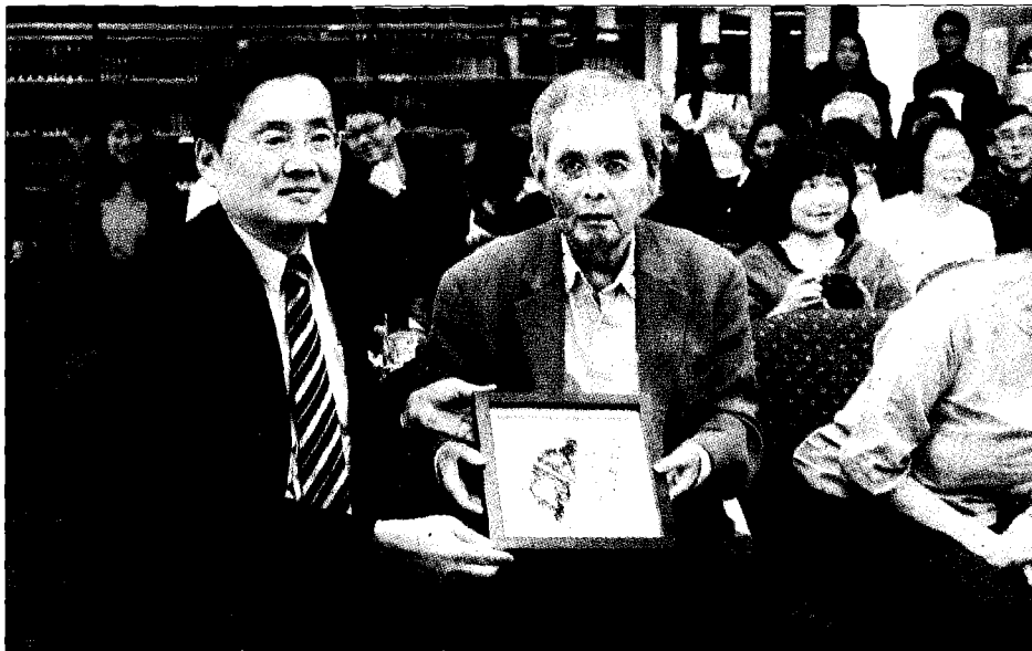
↑東華大學「楊牧文學研究中心」30日舉行揭牌儀式，東華大學校長趙涵捷（前左）致贈楊牧（前右）紀念牌。（中央社）

楊牧先後出版詩、散文專著超過50種，曾經榮獲時報文學獎、吳三連文藝獎、國家文藝獎、美國紐曼華語文學獎、馬來西亞花蹤文學獎及瑞典蟬獎之肯定。詩文已被翻譯成十數種外語，享譽國際，文學創作外，楊牧在文學研究、翻譯上也卓然有成，是馳名中外的比較文學學者。