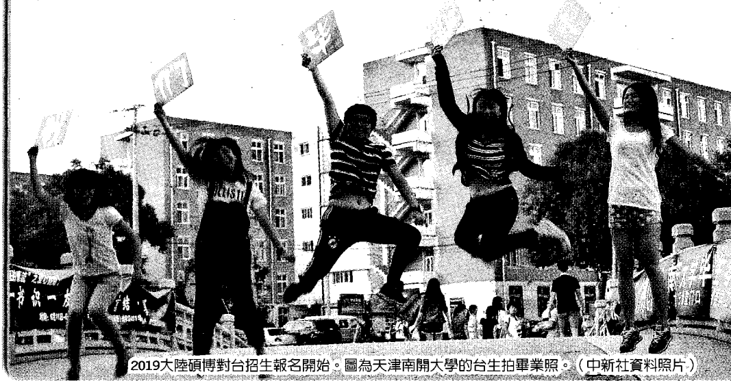
2019大陸碩博對台招生報名開始。圖為天津南開大學的台生拍畢業照。

2019年3月20日至4月14日下載列印准考證，2019年4月13日至14日初試，初試均是筆試，每科考3小時，個別科目如建築設計可多於3小時，但是不得超過6小時。初試成績由招生單位通知考生。