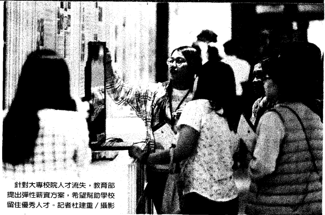
針對大專校院人才流失，教育部提出彈性薪資方案，希望幫助學校留住優秀人才。

教育部明定，彈性薪資額度計算，包括教育部補助經費及學校自籌經費。補助對象為編制外專案教師者，彈性薪資額