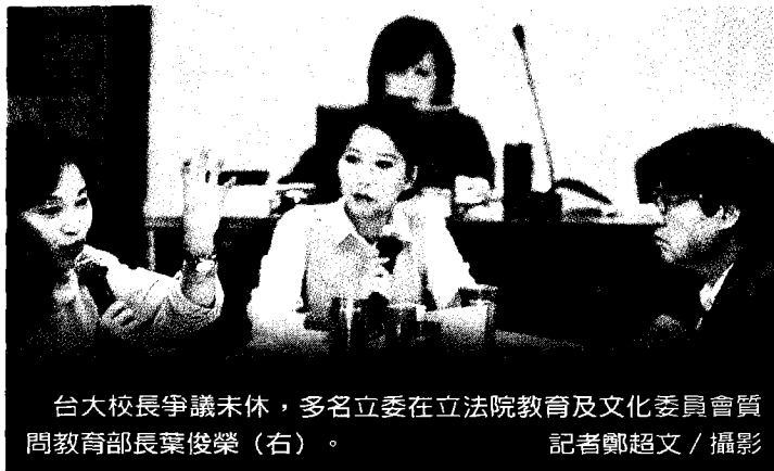
台大校長爭議未休，多名立委在立法院教育及文化委員會質問教育部長葉俊榮（右）。