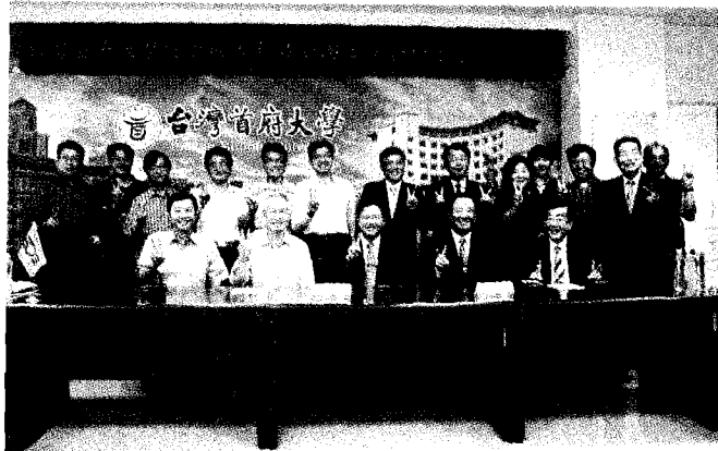
→ 救國團與台首大簽約，將進行多元方案合作。