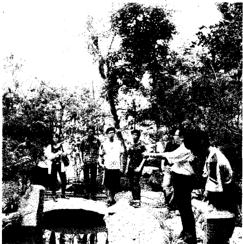
地下湧泉導入景觀花園，開放高中職學生到校觀摩。