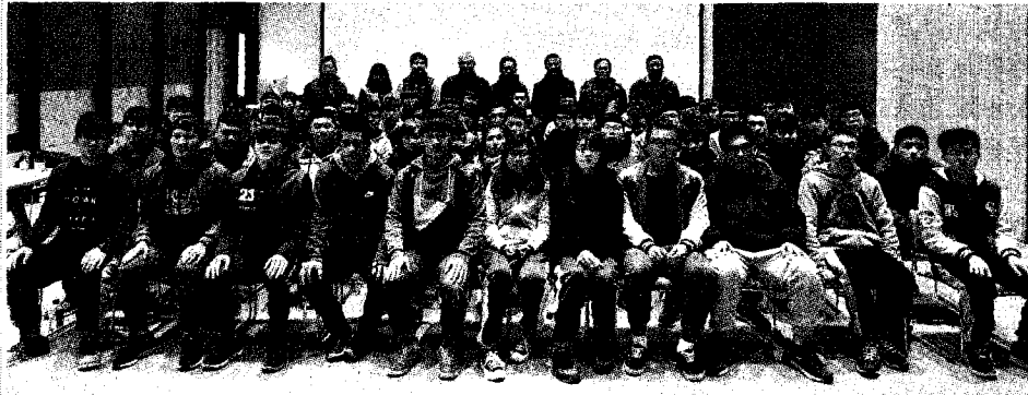
●國立屏東科技大學土木工程系產學攜手專班大合照。