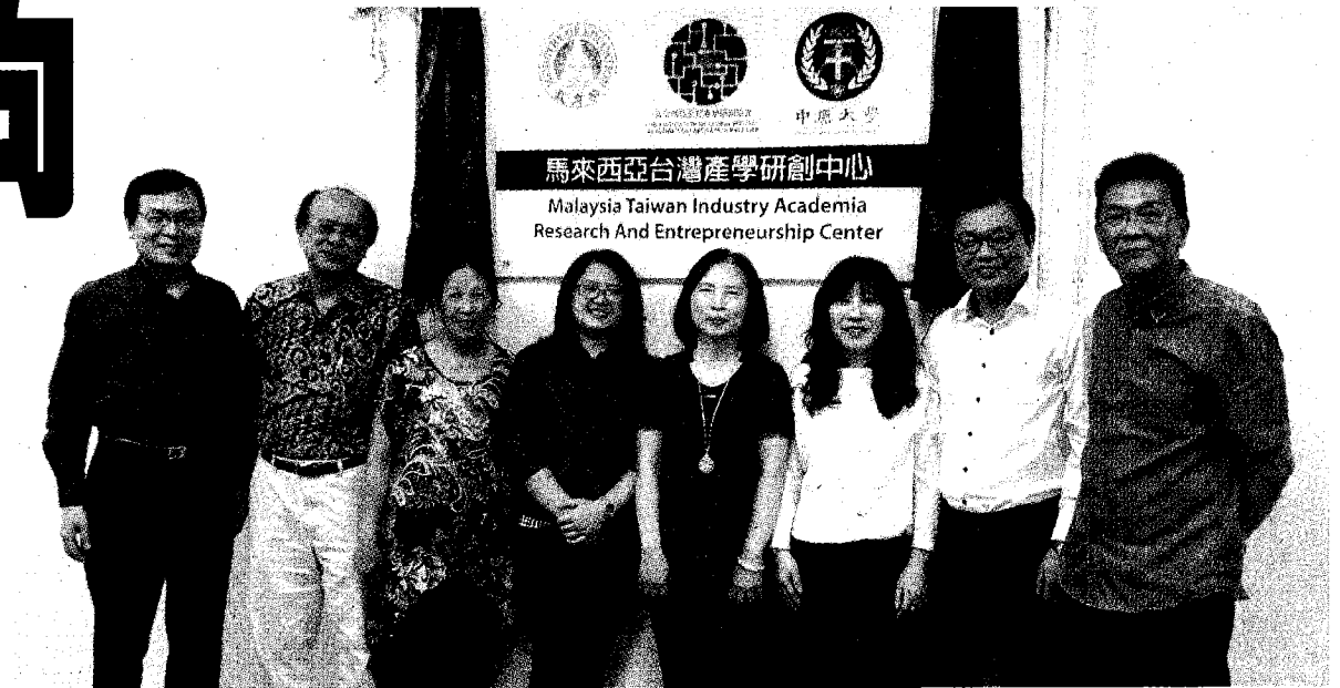
●馬來西亞台灣產學研創中心檳城辦公室，於2018年3月開幕。

今年9月，中原大學更獲科技部的厚愛與寄望，榮選為「國際產學聯盟」執行大學，於11月29日進行盛大啟動。現階段以「薄膜技術」及「智慧製造」兩大領域為主軸，以跨校院、跨產業、跨國際的產學研合作平台鏈結國際市場。目前已有多家國內外知