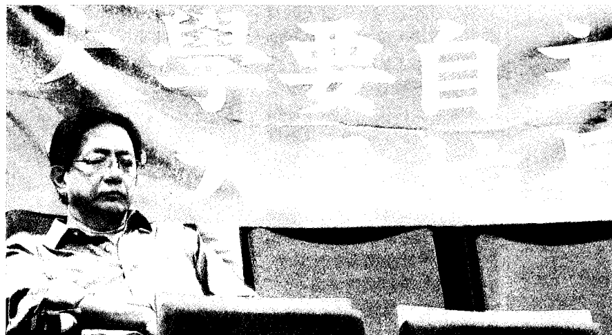
↑台大自主聯盟今天開記者會，要求盡速聘管中閔為台大校長。管中閔意外現身。

個前提沒有了，發生在管中閔身上的事情，也會發生在你我身上」，國家機器暴力地把手伸進校園，「讓台大陷入泥淖中」。世界各大學都在追求世界大學排名，若台大持續沒有校長，排名往後掉是必然的，而且會掉得非常厲害，同時代表國力往後掉。