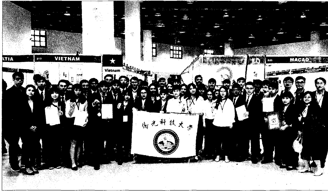
→ 僑光科大團隊勇奪八金五銀二銅一特別首獎。