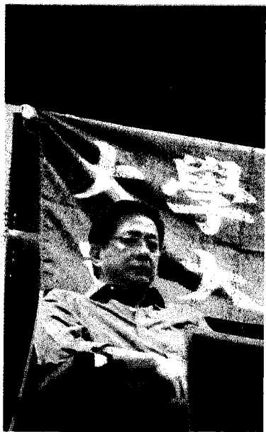
↑台大校長當選人管中閔也悄悄現身記者會。 (中央社)

↓台大自主聯盟十一日召開記者會，希望政府重視「台大沒有校長」對校園民主、大學自治與教育發展的傷害，嚴正呼籲「還我校長，台灣教育不能等」。 (中央社)