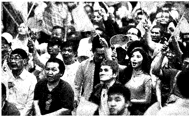
■九合一大選過後，屋主心態轉硬，除台南市之外，其餘五都待售屋主皆漲價。資料照片