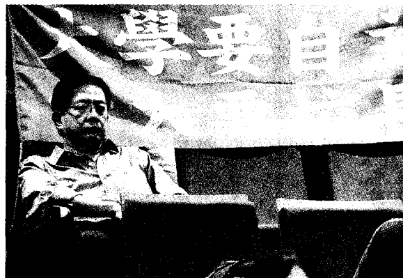
台大校長當選人管中閔昨天意外現身「還我校長—台灣教育不能等」記者會，低調坐在掛滿「還我校長」布條的觀眾席聆聽。

【記者馮靖惠、林良齊／台北報導】台大校長遴選案陷僵局，台大自主聯盟昨召開記者會呼籲教育部長葉俊榮不能要求合法行事的台大遴選委會重選，而是承認錯誤、聘當選人管中閔為台大校長，還邀葉俊榮到台大跟師生溝通。管中閔本人則首度現身自主聯盟活動現場，但未致詞，低調力挺。