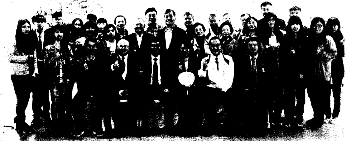
吳鳳科技大學與培元里培元長青關懷協會發展合作協議書簽約儀式。