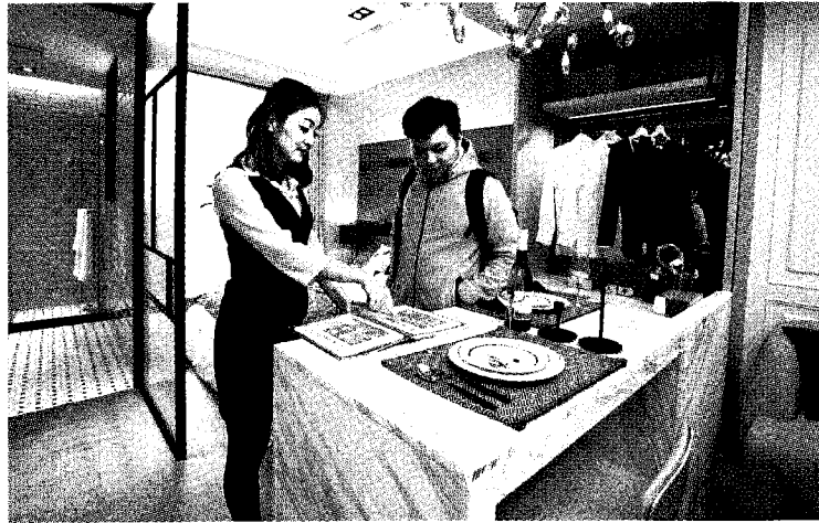
■六都僅台南市屋主表現淡定，漲價物件比例僅比選前高出9%。資料照片