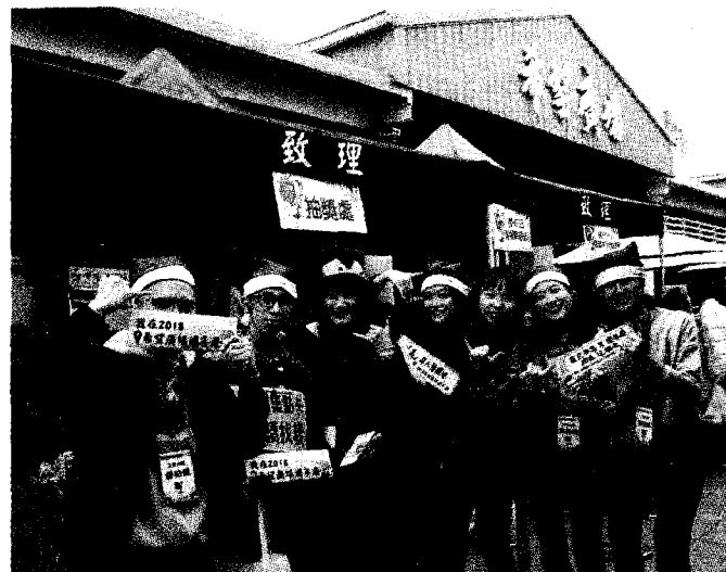
●致理科大同學發揮創意想法，為希望廣場周年慶注入活力，帶來商機。