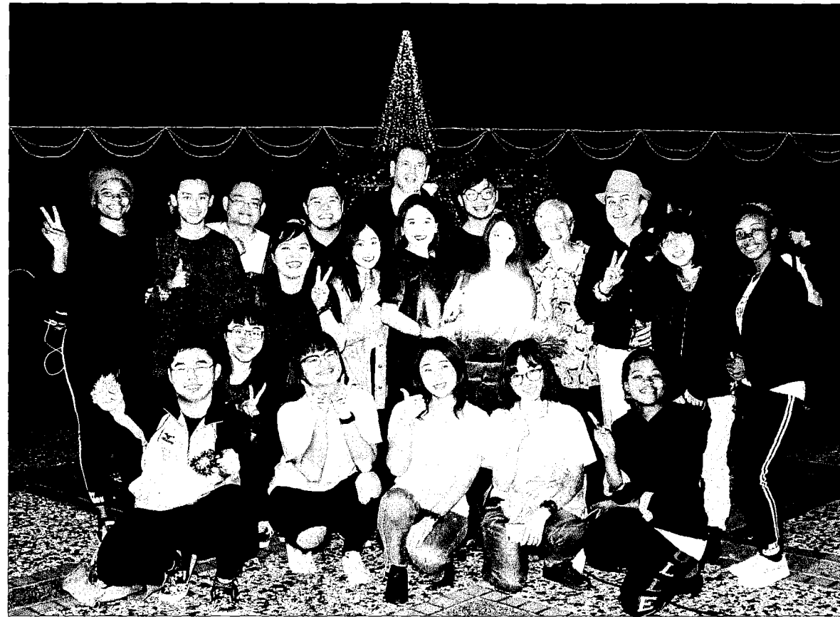
↑靜宜大學透過耶誕點燈，聯合全台共四十七所天主教學校募集毛毯及文具禮物包，送愛心到黎巴嫩的敘利亞難民營。

聯合全台47所天主教學校 募集五千二百條愛心毛毯及一萬份文具禮物包 捐助黎巴嫩難民營