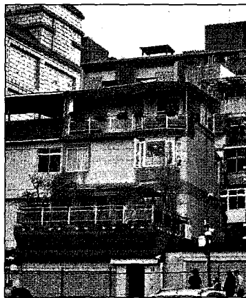
■孫鵬北投住處昨下午亮燈，疑狄鷺在家守候。