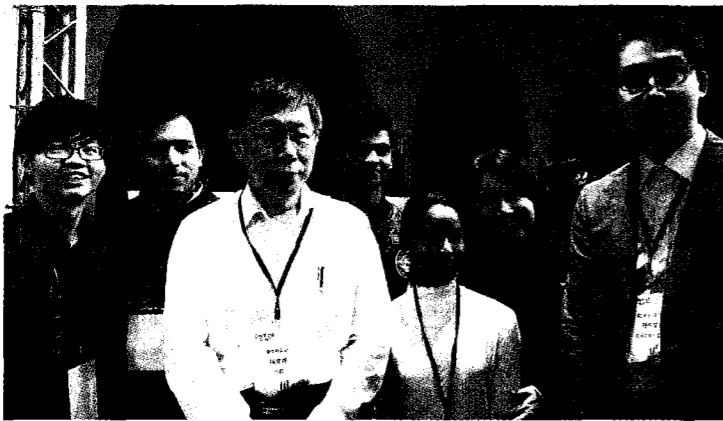
北科大參與南洋北流師生和台北市長柯文哲合影。

仁寶電腦工業副總經理丁長捷說，未來企業也需要在台的東南亞學生，精通在地語言與華語的雙語人才將成為企業在國際上的重要交流管道。