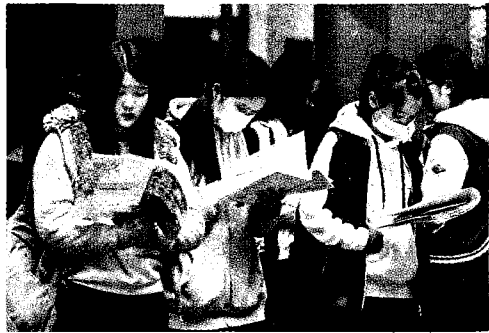
圖為學測考生把握時間低頭衝刺。

【本報台北訊】為減輕考生壓力，一〇八學年度起學測科目改由考生自由選考，大學繁星推薦、個人申請及考試分發等管道，使用科目從五科降為至多四科。但過往考生要進入理想校系，有落點可依循，新制上路後，恐很難選填志願。