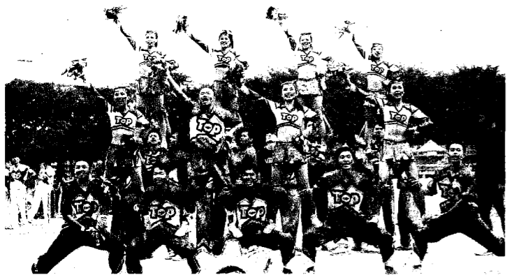
南臺科大今年校慶特別規畫睽違20多年的校慶運動大會，啦啦隊表演全場吸睛。