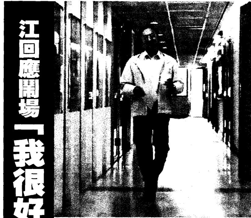
行政院前院長江宜樺前天回台大演講遭學生抗議中斷，他昨天南下中正大學，授課行程未受影響。

昨天上課的何姓學生表示，不管認不認同太陽花學運，課堂上仍應有學術自由，包括學生有上課的自由，老師有授課的自由，他不同意抗議行為破壞學生的上課權。他並說，江宜樺上課由淺入深，會根據學生程度因材施教，是很親近學生、很好的老師。