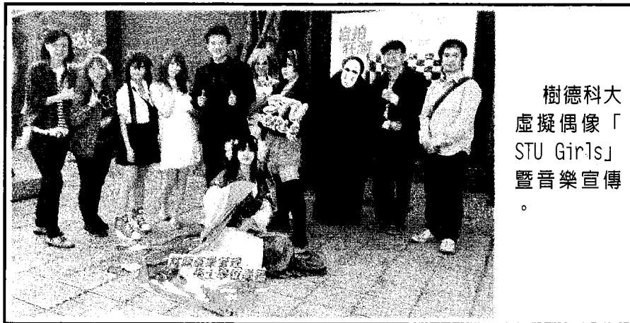
樹德科大 虛擬偶像「 STU Girls」 暨音樂宣傳

該系也預計在2019年推出ST Girls系列虛擬角色，其中包括正在角色設定的男角「小德」與寵物「小黑」及「狐狸」（按：這兩隻確實是樹德科大的校狗），並且配合學生團隊協助行銷管理STU Girls粉絲團，定期推出插畫與動漫、及相關活動。設計學院周伯丞院長也期待師生的用心可吸引更多動漫粉絲加入STU Girls，也為高雄市推廣動漫與電競產業貢獻一份心力。