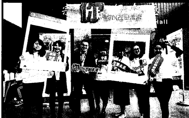
中原大學長期推動三創教育，鼓勵學生培養解決問題的能力。