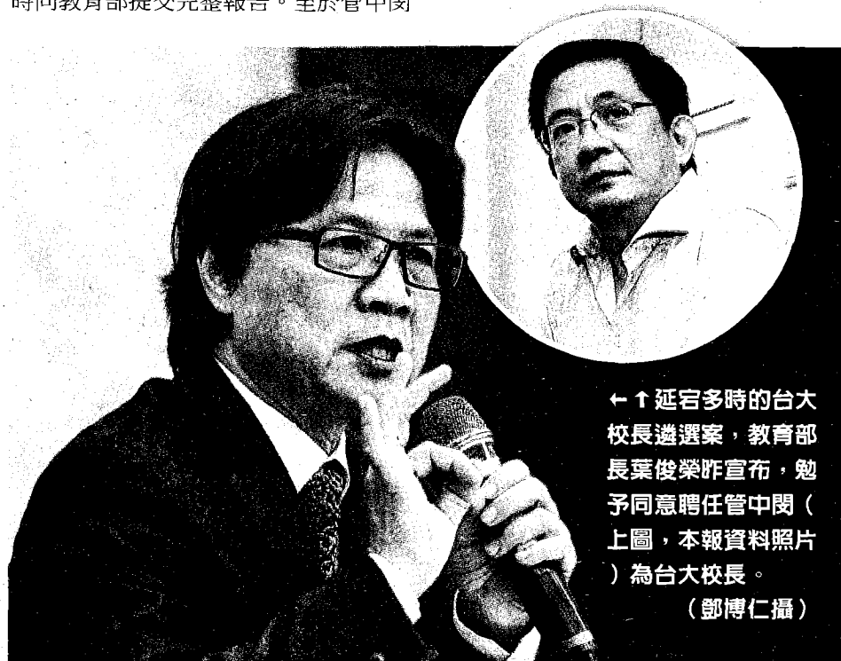
← ↑ 延宕多時的台大校長遴選案，教育部長葉俊榮昨宣布，勉予同意聘任管中閔（上圖）為台大校長。

葉俊榮說，台大遴選委員會面對這些爭議質疑，只在7月底、8月初以電子郵件詢問遴選委員的意見後對外發表聲明說「程序沒問題」，一直抗拒以實質開會、形成