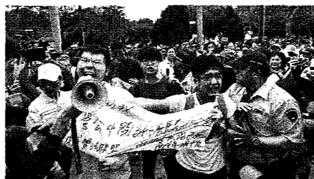
■管中閔聘任案引發挺管、反管兩派對立，圖為反管學生抗議。資料照片

台大遴選案容或有行政瑕疵，但只要候選人沒學術倫理問題，也無賄選情事，教育部還是宜尊重大學自主精神。