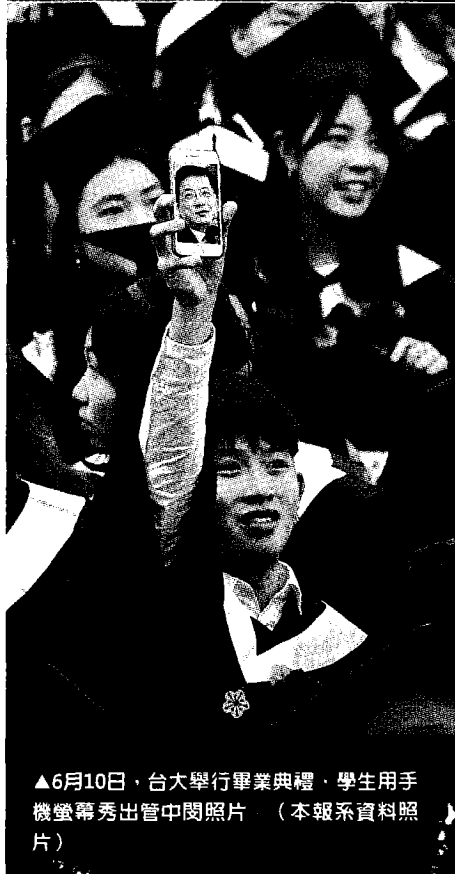
▲6月10日，台大學行畢業典禮，學生用手機螢幕秀出管中閔照片（本報系資料照片）

「讓挺管、拔管爭議隨2018年的結束而消逝，教育部勉予同意聘任管中閔為台大校長。」葉俊榮說，他身為教育部長，會為這個決定負起完全責任。