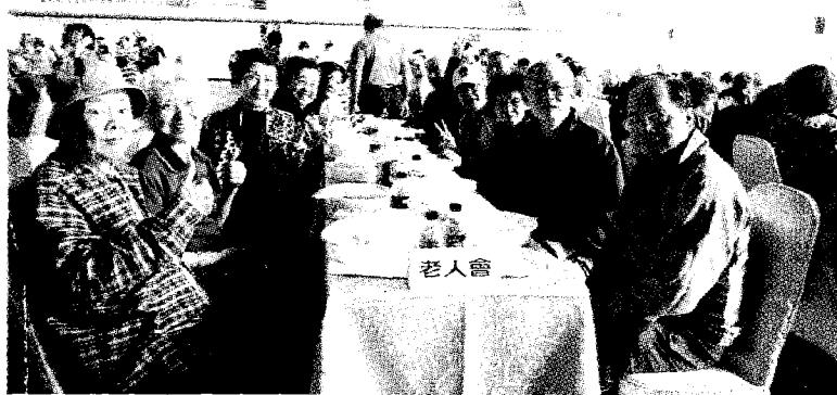
●來自林口各地的長者們愉快地共聚一堂。