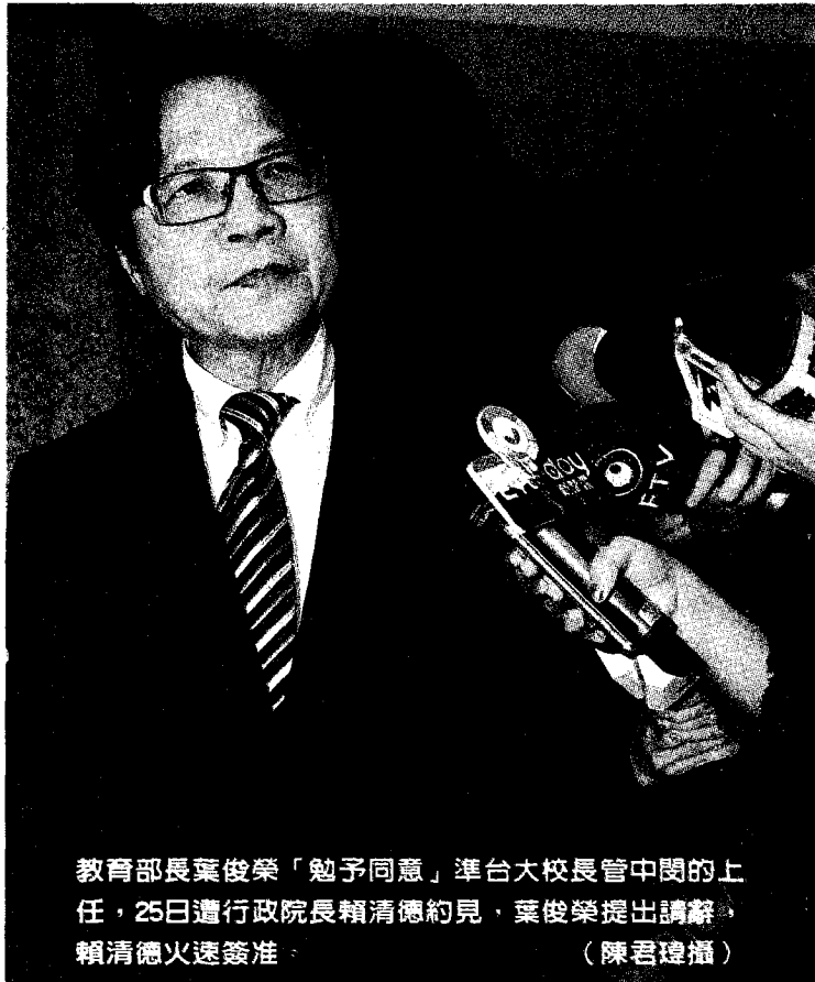
教育部長葉俊榮「勉予同意」準台大校長管中閔的上任，25日遭行政院長賴清德約見，葉俊榮提出請辭，賴清德火速簽准。

林志成、簡立欣、李侑珊、張理國／台北報導 教育部長葉俊榮24日宣布「勉予同意聘任管中閔為台大校長」，引來府院及民進黨的不滿，他昨天以「承擔所有政治責任」、「十字架我來扛」，請辭獲准，任期163天，是第三個因為台大校長遴選案下台的部長。台大則已回文教育部，管中閔明年1月8日上任。