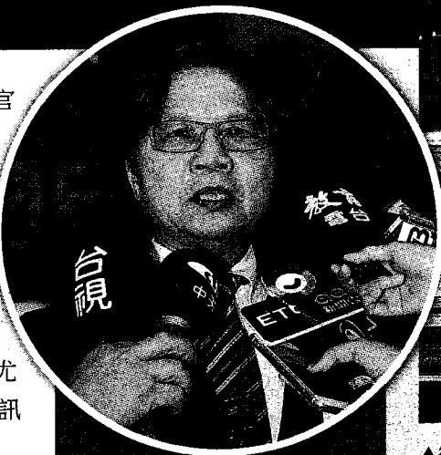
▲教育部長葉俊榮25日請辭獲准

先表示，總統有請賴院長到官邸，針對24日教育部宣布台大校長遴選案一事交換意見。總統認為，此案社會高度關注，作為執政團隊的一員，相關決策應該經過完整的溝通與討論。總統認為，24日的處理，讓大家措手不及，尤其讓執政黨團的立委被動獲知訊息，顯然需要檢討。