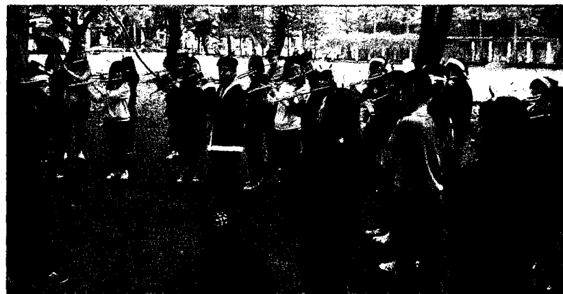
台南應用科大聖誕節樂聲飄揚，音樂系長笛快閃！

尤其，在美麗的氣氛中飄揚著音樂系同學祥和的聖誕樂曲，樂聲傳唱悠遠，彼此互道平安祝福，溫暖著歲末冬寒中的人心，霜葉隨風而落，唯師生的熱情與祝福，飄揚在無盡的暮色中。