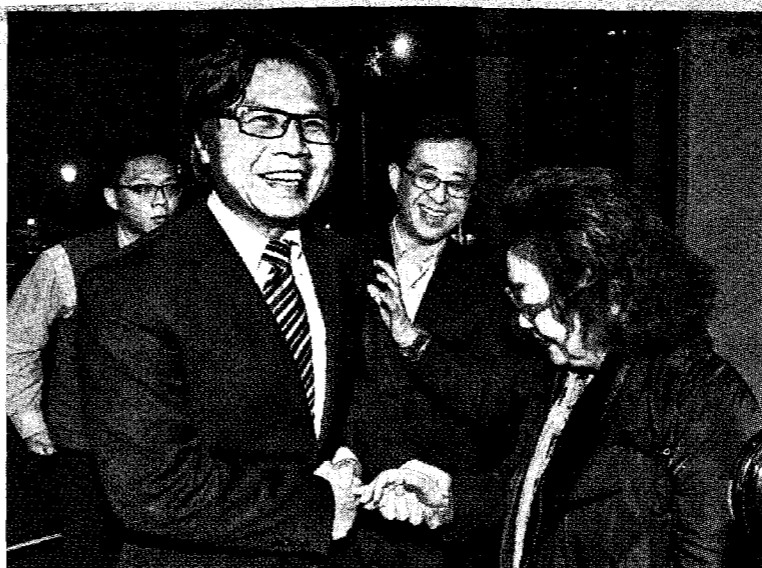
葉俊榮昨晚燦笑回到教育部，強調他處理管案做了對的事。

據了解，葉俊榮7月接任教長時，執政高層就是希望葉能釐清管案程序問題、補足程序正義，「就算結果是通過也沒有關係」；蔡總統也曾表示，希望葉與各方溝通，