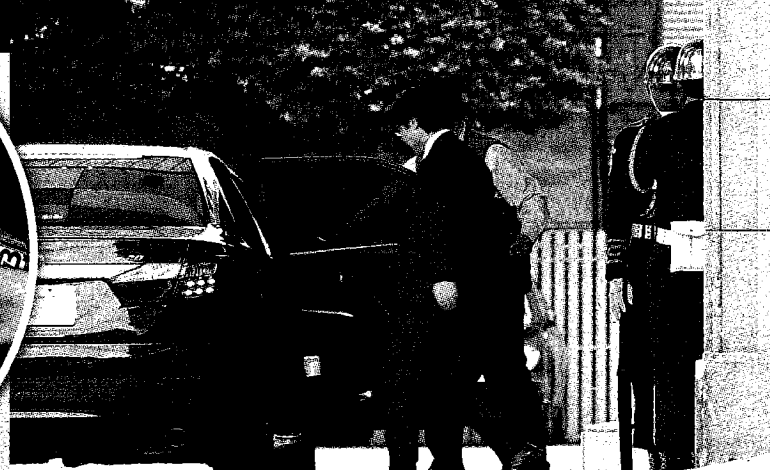
▲行政院長賴清德25日約見教育部長葉俊榮(左)。圖為會後葉俊榮離開行政院。(中央社)

林鶴明指出，蔡英文在與王金平、陳菊的會面中強調，基於外界對於遴選程序的質疑，為了台大的學生，希望台大遴委會可以展現彈性和善意來處理，不能鐵板一塊，應尊重教育部的權責。但雙方各自堅持立場，會談並無