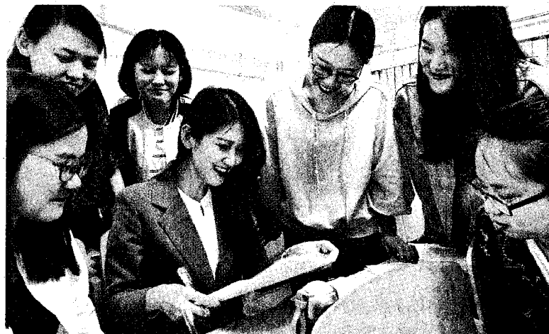
老台生觀察，七成赴陸台生會選擇留在大陸發展。

在美商公司工作的李女士有一雙兒女，女兒在台灣讀大學，兒子在明星高中讀高二。她表示，雖然說今年台生赴陸媒體報導很多，但家長圈都知道這不是今年才開始，「兩年前已經有種逃難的氛圍！」台灣大專校院倒閉潮、優質教師和菁英學生出走，太