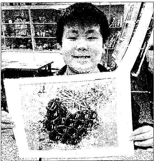
▲苗栗縣坪林國小學生將當地水果葡萄，融入版畫。

在卓蘭農產興業計畫成果發表會中說，中原大學師生透過品牌化、網路化，帶來大量訂單，為地方培育更多農業及商業人才。