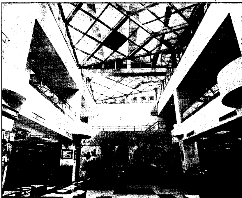
朝陽科大將圖書館中央空調汰換為變頻磁浮離心式主機，並建置資訊線機房，年節電率超過百分之四十五。