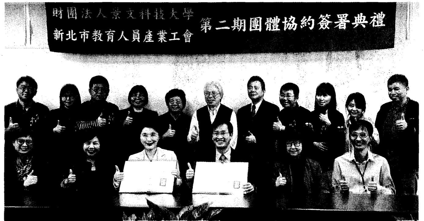
↑ 私立景文科技大學與新北市教育人員產業工會（代表勞方）昨日完成第二期團體協約簽署。

首次私立大專院校與工會簽第二期協約 學術研究加給比照教育部標準 年終獎金發放月數明確化