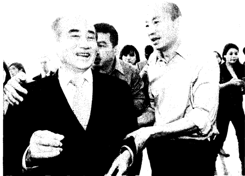
↑前立法院長王金平昨日到市府拜會市長韓國瑜，韓國瑜感謝王金平出錢出力出汗，選舉造勢很成功。

記者戴淑芳／台北報導 國立陽明大學昨日召開校務會議，確定通過優先與國立交通大學議約合校，主要考量為交大承諾未來合校校名為「國立陽明交通大學」。陽明大學學生會也表示，認為此決議與學生公意一致，樂觀其成。