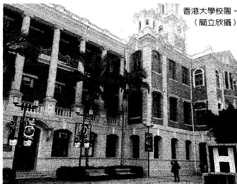
香港大學校園。

香港教育大學要求4科中必須包括國文和英文，香港嶺南大學更僅要求「最佳4科成績（須包括英文）」。