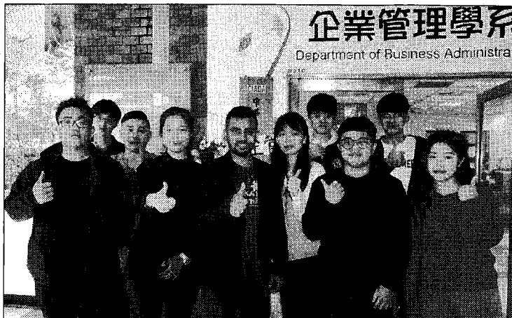
大葉大學開設財務管理課程，讓學生與國際師資互動學習，拓展國際視野，提升英語能力。