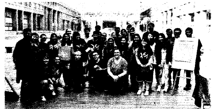
國立中山大學管理學院積極發展國際化學習環境。