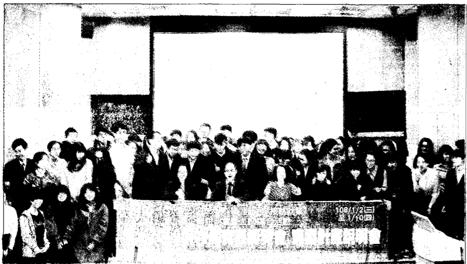
→僑光科大舉辦在校生實習博覽會，有各大公司台新銀行、星巴克等參與。 中華日報C6版

僑光科大有完善實習機制且成效豐碩，在教育部一〇六學年首次辦理之技專校院實習課程績效評量，榮獲受評「通過」殊榮。僑光持續辦理大型實習博覽會及媒合活動，亦獲評鑑委員高度肯定。教育部該年度辦理績效評量，受評量的全國八十七所技專校院，有十六所學校經評定為「通過」，通過率僅十八%。