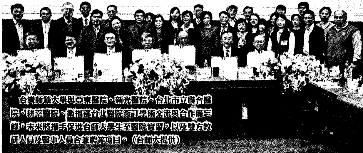
台灣師範大學與亞東醫院、新光醫院、台北市立聯合醫院、耕莘醫院、衛福部台北醫院簽訂學術交流與合作備忘錄，未來將攜手促進台師大學生至醫院實習，以及雙方教研人員及醫事人員合兼聘等項目。