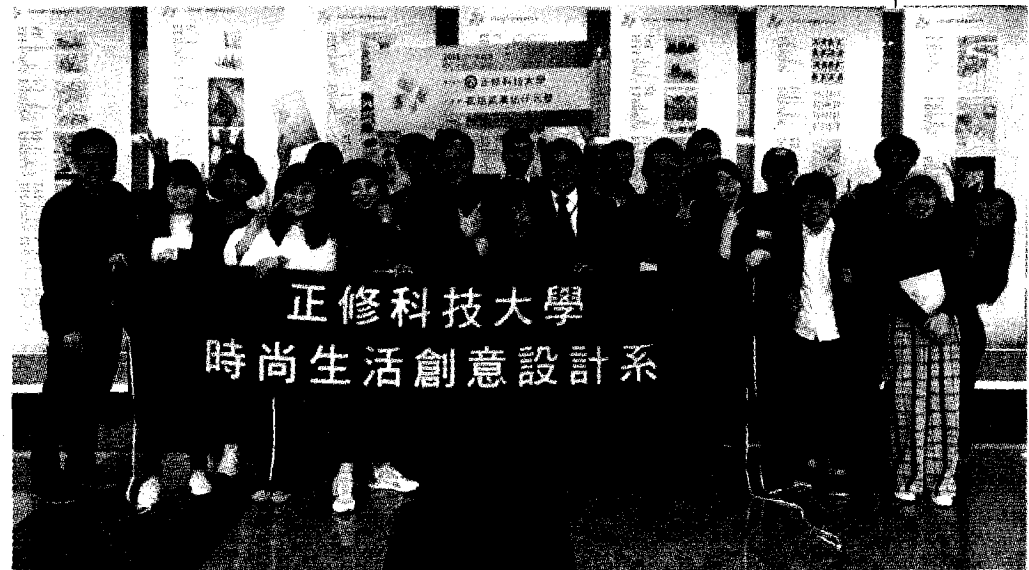
正修科大時尚生活創意設計系躍上國際舞台連連得勝再創高峰！