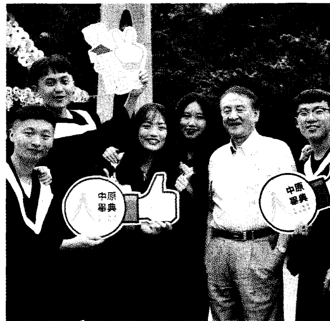
●中原大學校長張光正（右二）與畢業生合照。

「產學鏈結、學用合一」的實作教育是中原大學教學卓越計畫的重點之一，該校擁有強大的產研動能，且校內積極推動的「工業4.0創新創業示範基地」，目前也與鴻海、日月光、台達電、友嘉及華新麗華等國內大型知名企業簽署產學合作專案，除了可貢獻學界的產能研發成果，更可提供全面