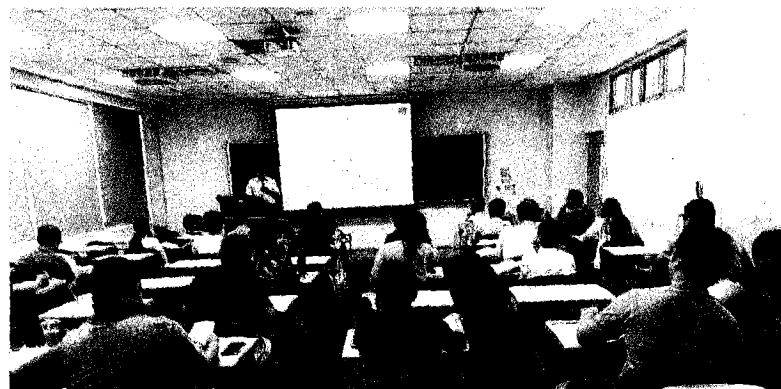
台灣都市更新推動全國學會與華夏科大研發處推廣教育中心合作都更相關課程，吸引衆多人聆聽。

而台灣新創都更集團拆解各個環節，以專業分工，並且以創新的營運模式在業界投下震撼彈，殺出重