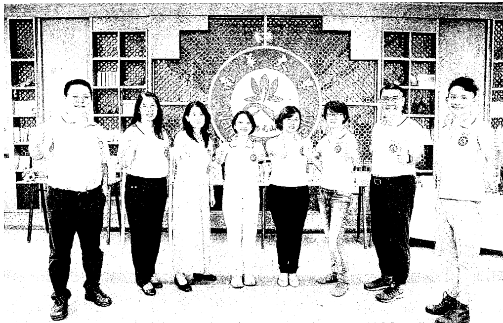
南華大學註冊率近95% 全國私校第一。