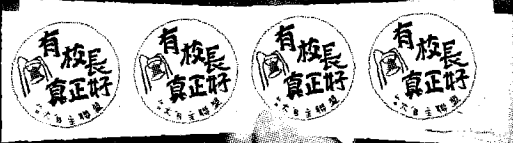
▲台大校長交接典禮上，台大自主聯盟在會場發放「有校長真正好」貼紙。