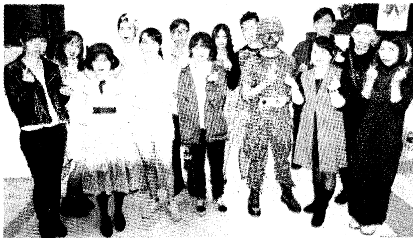
大葉大學藥用植物與保健學系「化妝心理學」課程期末成果展示，透過實務操作，累積应用能力。