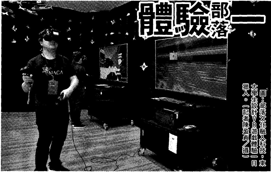
圖：部落文化融入科技，東大學生設計VR遊戲體驗一日獵人。

記者陳盈貞／報導 為落實教育部USR大學社會責任實踐計畫，國立臺東大學與臺東縣金峰鄉合作，由數位媒體與文教產業學系三年級學生利用VR、AR技術，將金峰鄉著名景點及傳統文化融入互動遊戲，加以推廣發揚。在專題指導老師許志維、賀俊智帶領下，學生們走訪金峰鄉嘉蘭部落，實地探查當地原住民文化特色，並融入部落生