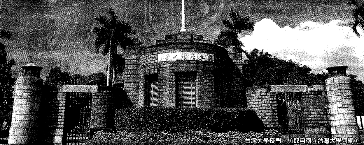
台灣大學校門