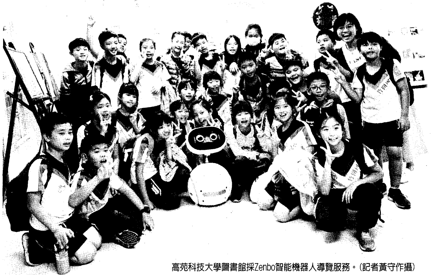
高苑科技大學圖書館採Zenbo智能機器人導覽服務。