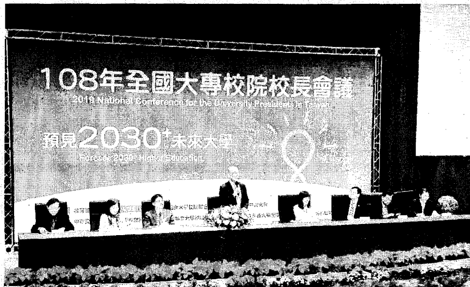
108年全國大專校院校長會議，昨日在中興大學舉行第二天議程。