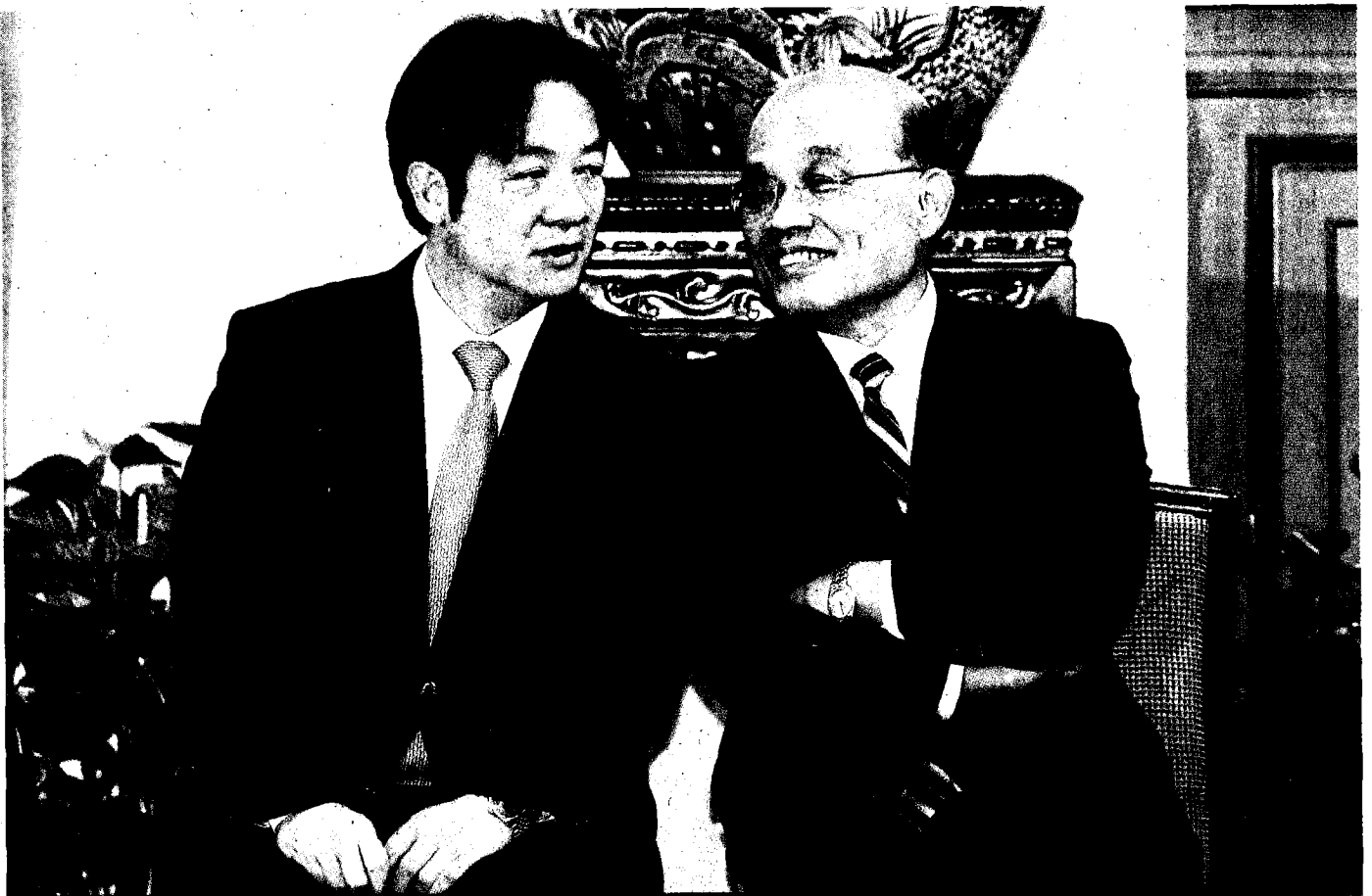
賴清德（左）昨率內閣總辭後，蔡英文總統隨即在總統府舉行記者會宣布新任閣揆由蘇貞昌（右）出任，賴、蘇一同出席記者會，兩人比肩而坐、神情輕鬆。