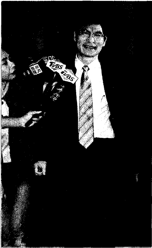
↑行政院長賴清德將卸任，十一日晚間在台北圓山大飯店宴請閣員，預計將轉任教育部長的科技部長陳良基（右）也出席與會。

出身雲林農家子弟的陳良基，常自稱「田庄囡仔」，他是成大電機系出身的土博士，曾任台大創意創業學程主任、晶片系統國家型科技計畫共同主持人、國家實驗研究院長、台大副校長等職務，四度獲得台大教學優良獎，並獲頒教育部終身榮譽國家講座，研究、教學、產學合作表現都非常優異。