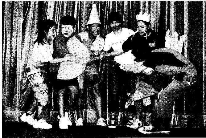
大葉大學觀光系「海底撈」表演，囊括第一名與最佳人氣獎。