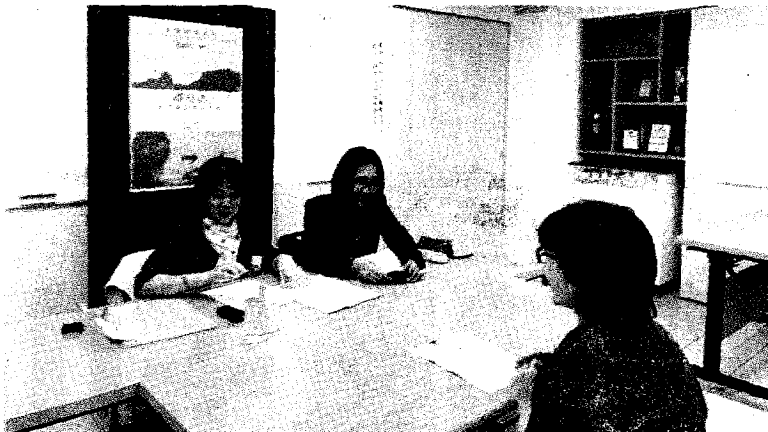
●致理科大舉辦越南語檢定：圖為學生接受個別口試情形