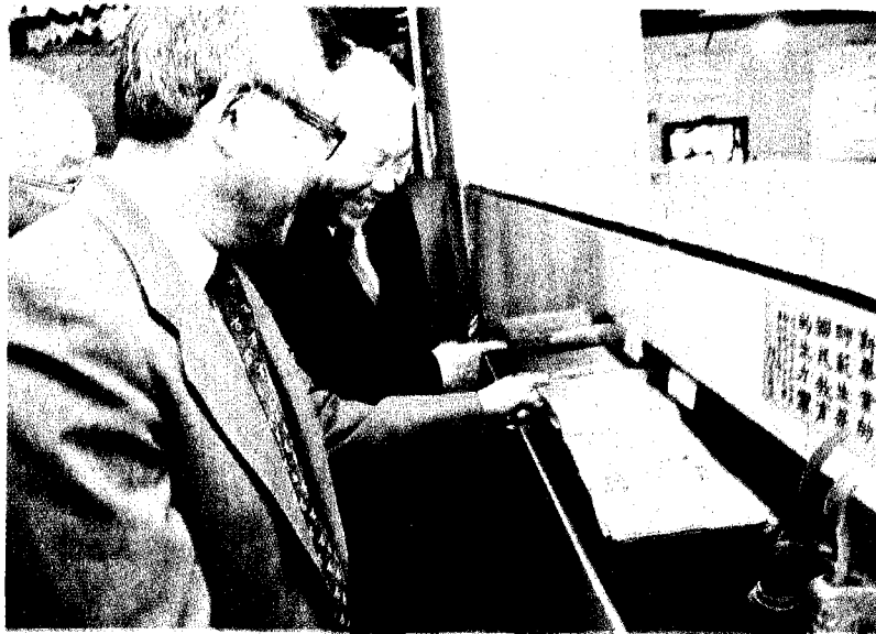
↑新竹教育大學2016年與清華大學合校，清華在南大校區設立「竹師會館」校史館十五日揭幕啓用。