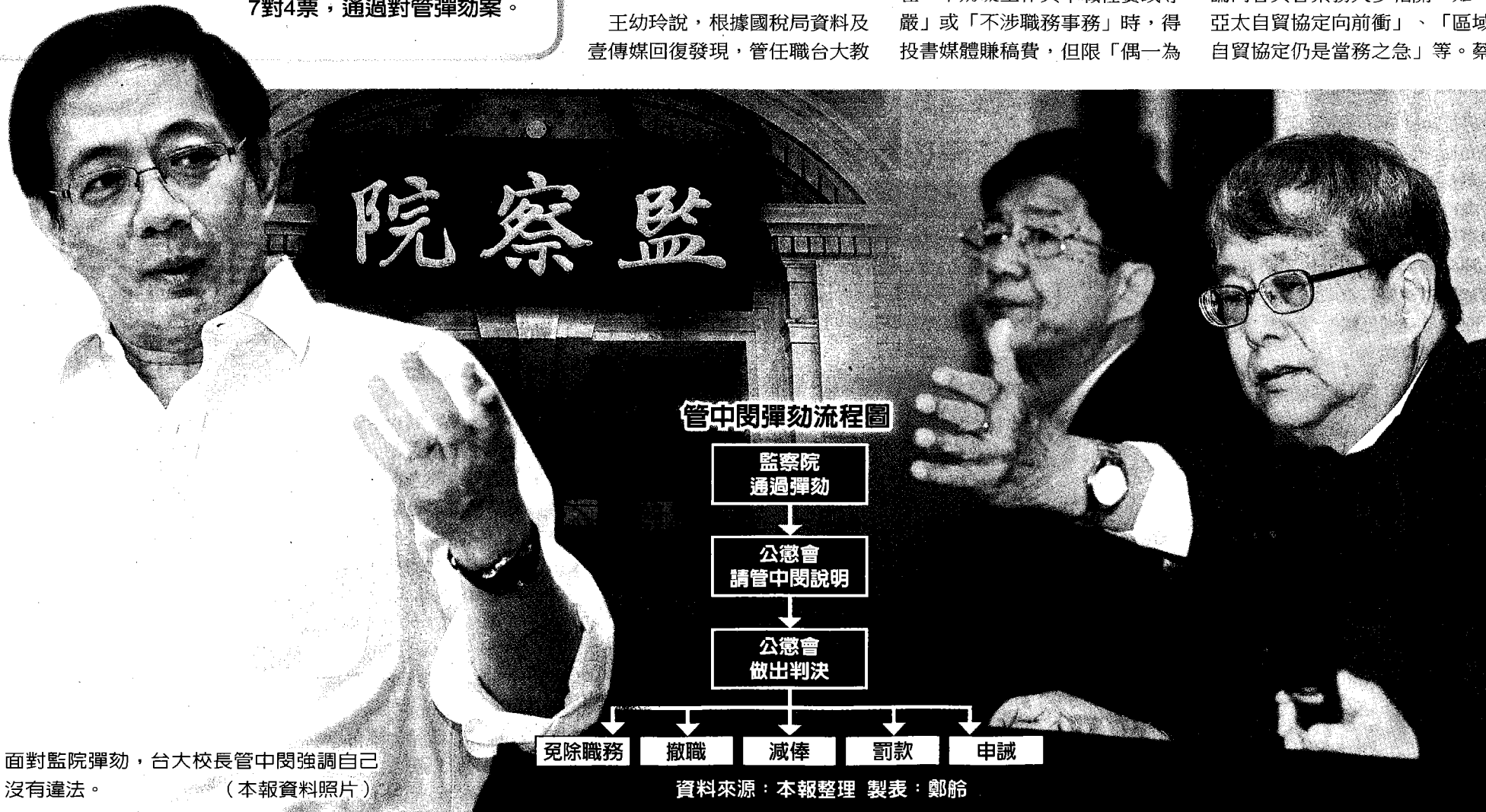
管中閔彈劾流程图