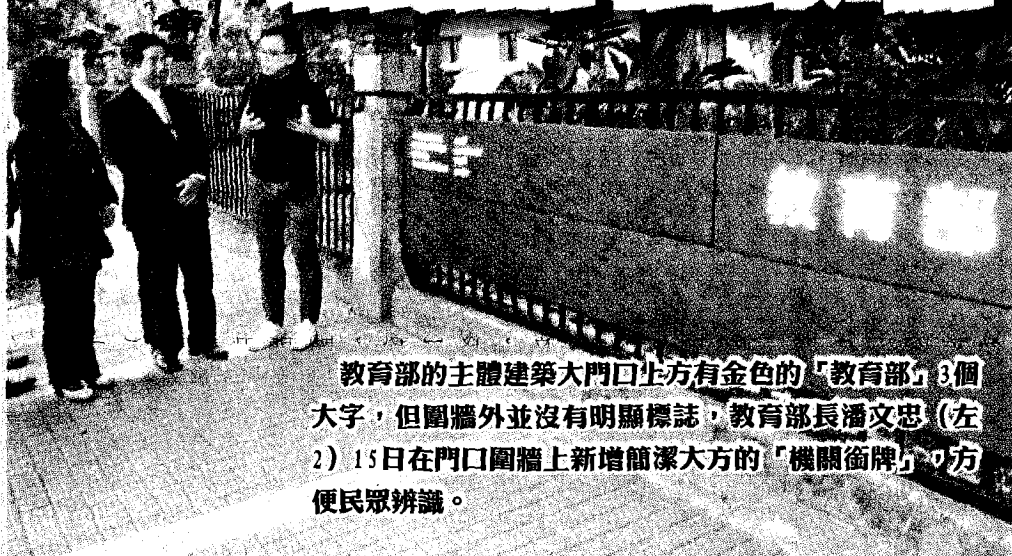
教育部的主体建築大門口上方有金色的「教育部」3個大字，但圍牆外並沒有明顯標誌，教育部長潘文忠（左2）15日在門口圍牆上新增簡潔大方的「機關銜牌」，方便民眾辨識。

【台北訊】教育部長潘文忠啟動教育部新的「機關銜牌」，最特別之處是除了中文和英文，還增加了7種「新南向國家」語言。