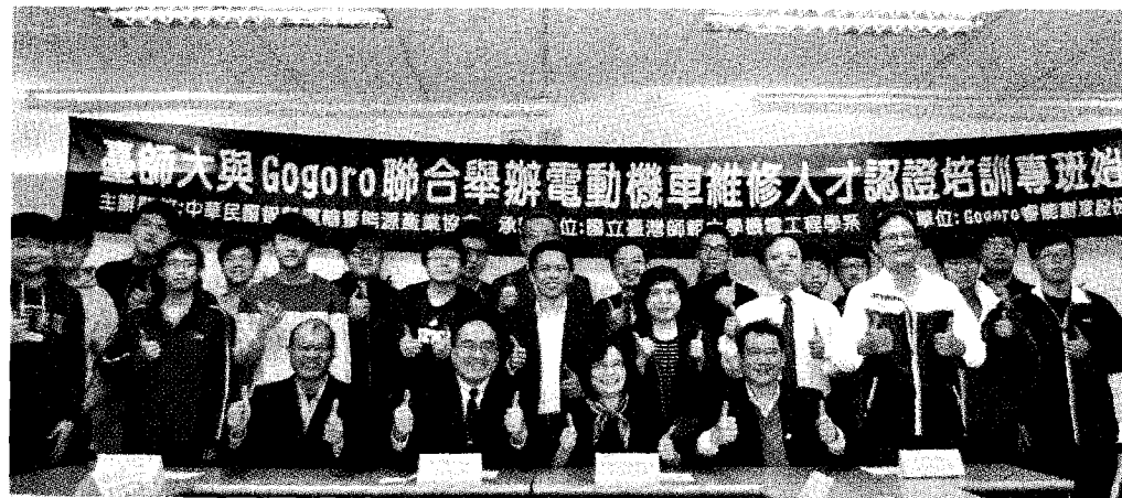
● 臺師大與Gogoro人才培訓課程正式開訓，也為國內電動機車產業開啓新氣象。

該課程經過14天的課程訓練後，全部學生將參與Gogoro維修技術認證，學生通過課程認證後將具備Gogoro電動機車維修能力，並可獲得合格證書；