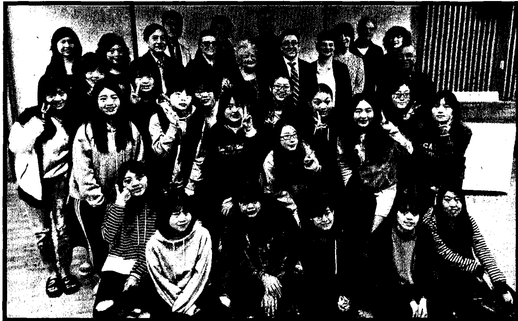
朝陽科大為歐洲教師教育網絡第一個臺灣的會員學校，國際化成果豐碩。