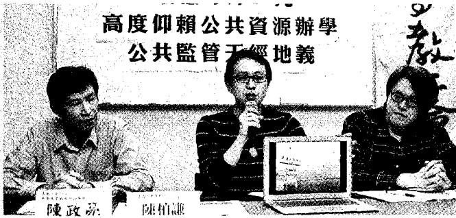
高度仰賴公共資源辦學 公共監管干預地義