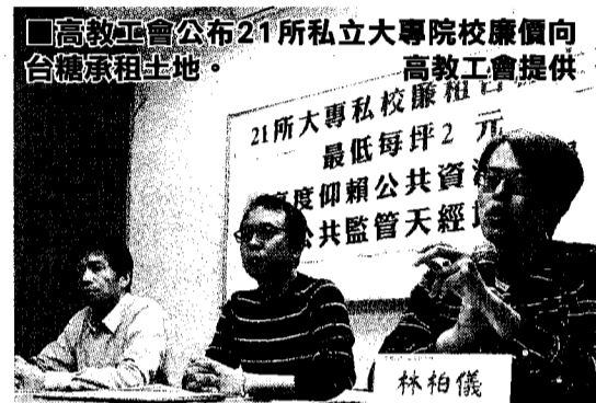
高教工會公布21所私立大專院校廉價向台糖承租土地。

對於永達一案，教育部說，永達停辦後依規定可轉型為社福文教機構，但近日學校違反規定將處分大樓所得償還董事，因此教育部不會核准永達的轉型計畫；若永達未將先前違法償還的錢先拿回來，教部將在明年1月5日要求永達解散清算。《蘋果》昨截稿前未能取得相關私校說法。