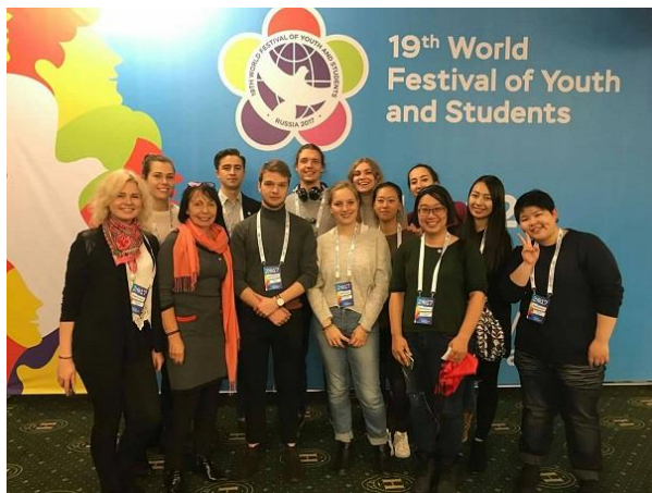
文藻外大修讀碩士三方學程學子，2017年於俄羅斯求學期間，參加當地「第19屆世界青年和學生節」