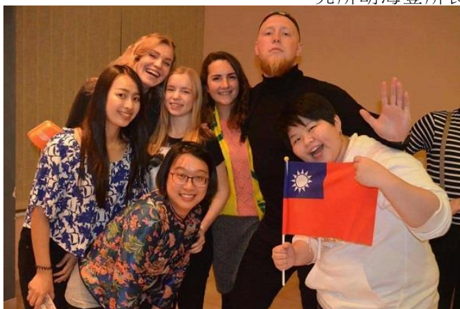
文藻外大「國際事業暨跨文化管理研究所」碩士三方學程研究生，前往俄羅斯上課八周，與當地學生合影