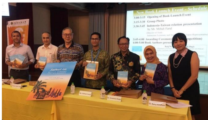
文藻外大東南亞碩士學位學程出版《東南亞：超越國界與邊境》英文專書，收錄來自馬來西亞、泰國、越南、印尼、菲律賓、新加坡及台灣十位學者學術論文。