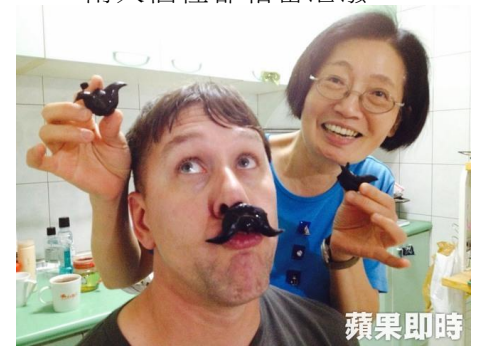
布朗第一次吃到菱角，特別拍攝照片紀念。