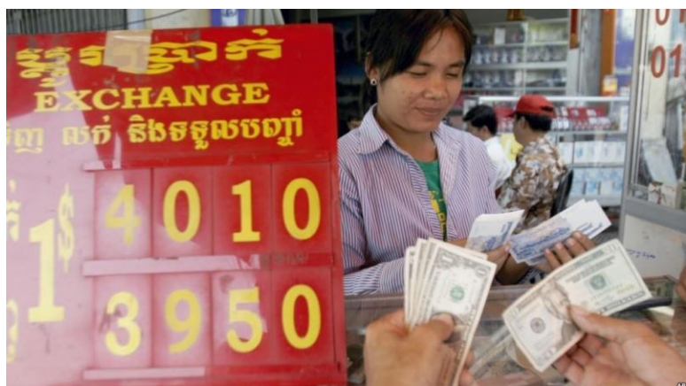
柬埔寨日常流通貨幣是美元和柬幣併用，柬幣更像是用來找零的，而且付美金的匯率還比較好。