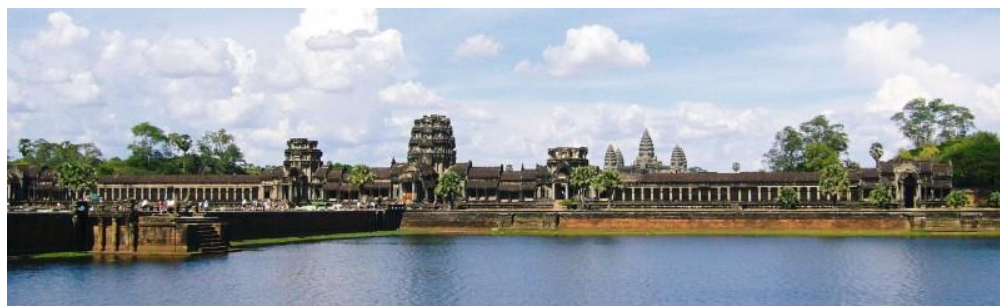
被列為聯合國世界遺址的吳哥窟，每年吸引百萬國際觀光客，其門票都以美元標示，而非柬幣。