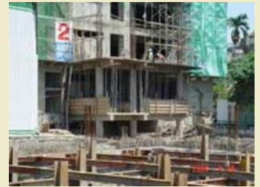
4.文化走廊2FL施工照片