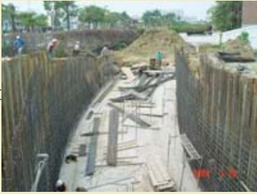
1.研究大樓地下車道側牆施工照片