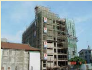
2.教學大樓西面立面照片