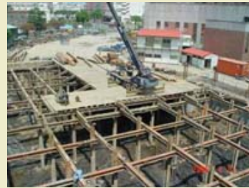
3.研究及會議大樓地下室第二層安全支撐架設施施工照片