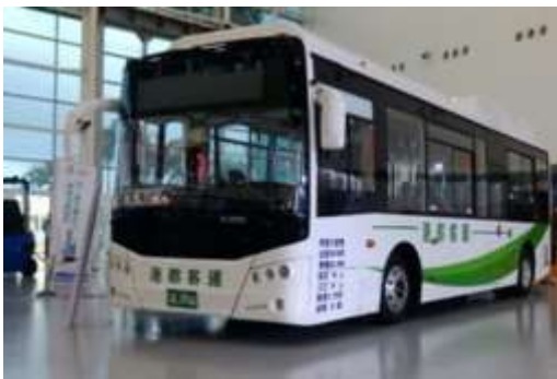
雙槍充電，15分鐘充足電