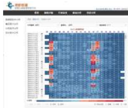
大數據分析平台客觀掌握每站點及每班次人數、站間運量