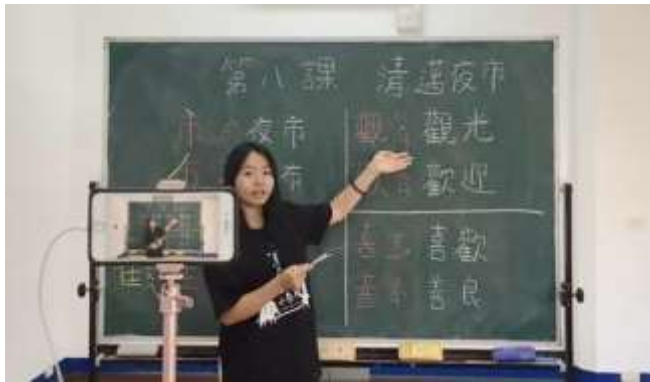
國立台北教育大學學生建置「國北小泰陽學習資源網」。