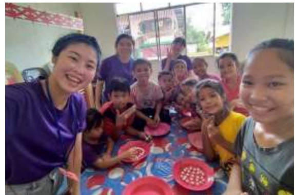
成大馬來西亞資訊教育志工團以前到當地，還會帶領社區孩童搓湯圓，介紹台灣傳統習俗。