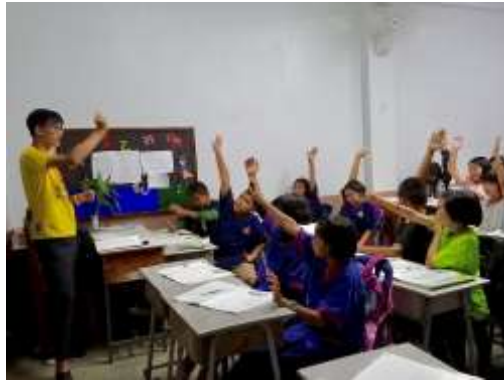
國立台北教育大學「小泰陽服務隊」往年都到泰北華文學校進行志工服務。