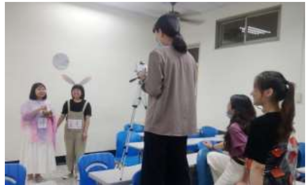
靜宜大學師生為柬埔寨米樂國際學校錄製中秋節線上教材。