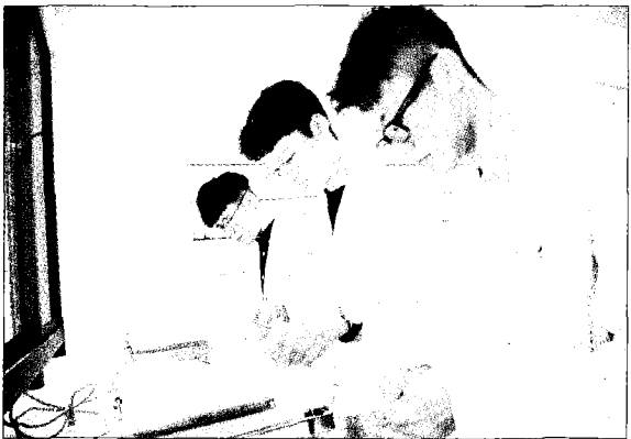
→嘉藥建校五十五年，從藥理出發培育許多優秀藥師。