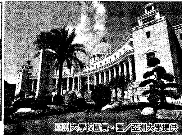
亞洲大學校園景。

資料來源：英國泰晤士報官網 www.timeshighereducation.com