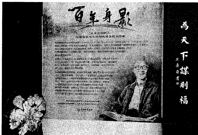
●育達科大舉辦「百年身影～王廣亞創辦人百歲冥誕追思佳句徵選暨藝文特展」活動。

，字裡行間，思念滿溢、真情流露；又有八位書法家爭相創作，將佳句寫成墨寶。活動全程影片除了有董事長和校長的隆重致詞，也有創辦人摯友及部舊的感懷分享，最後由育達科大傑出校友知名書法家古員齊為活動主題「百年身影」揮毫展演，象徵王創辦人書藝傳薪的意