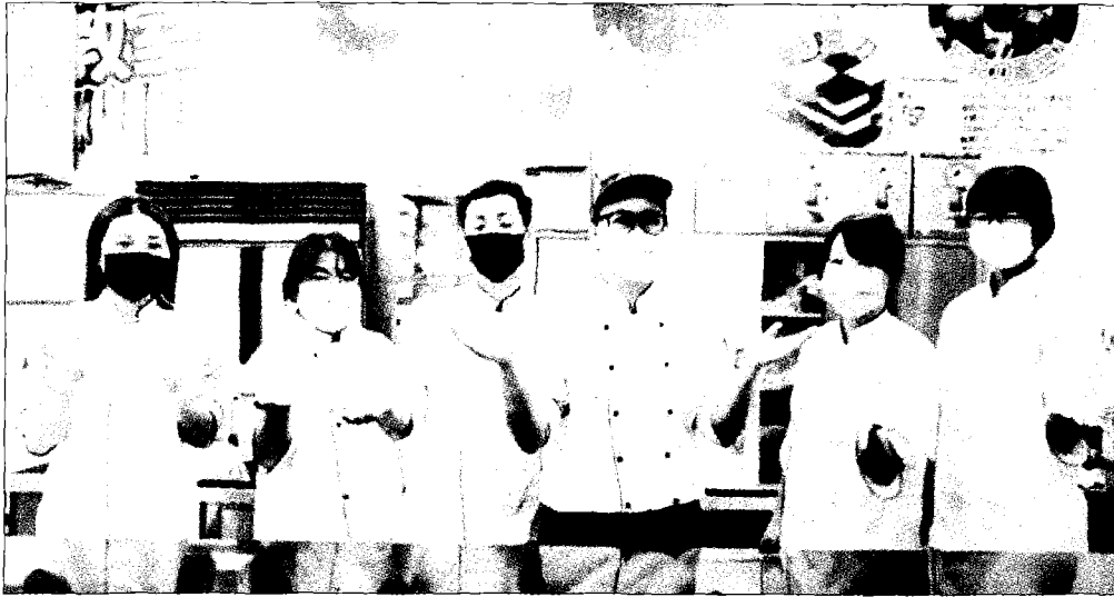
↑台首大的烘焙教室成為製作影片的地點，並由教職員擔綱演出影片內容，期貼近年輕學子的心。