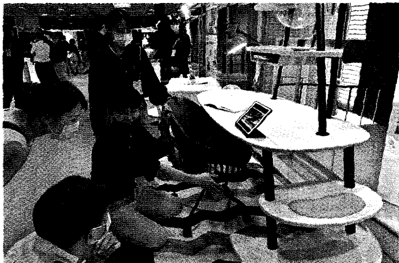
↑ 樹德科大產設系師生設計的「人貓共融書桌」，在「二〇二一金點新秀設計獎」榮獲「金點新秀贊助特別獎」。