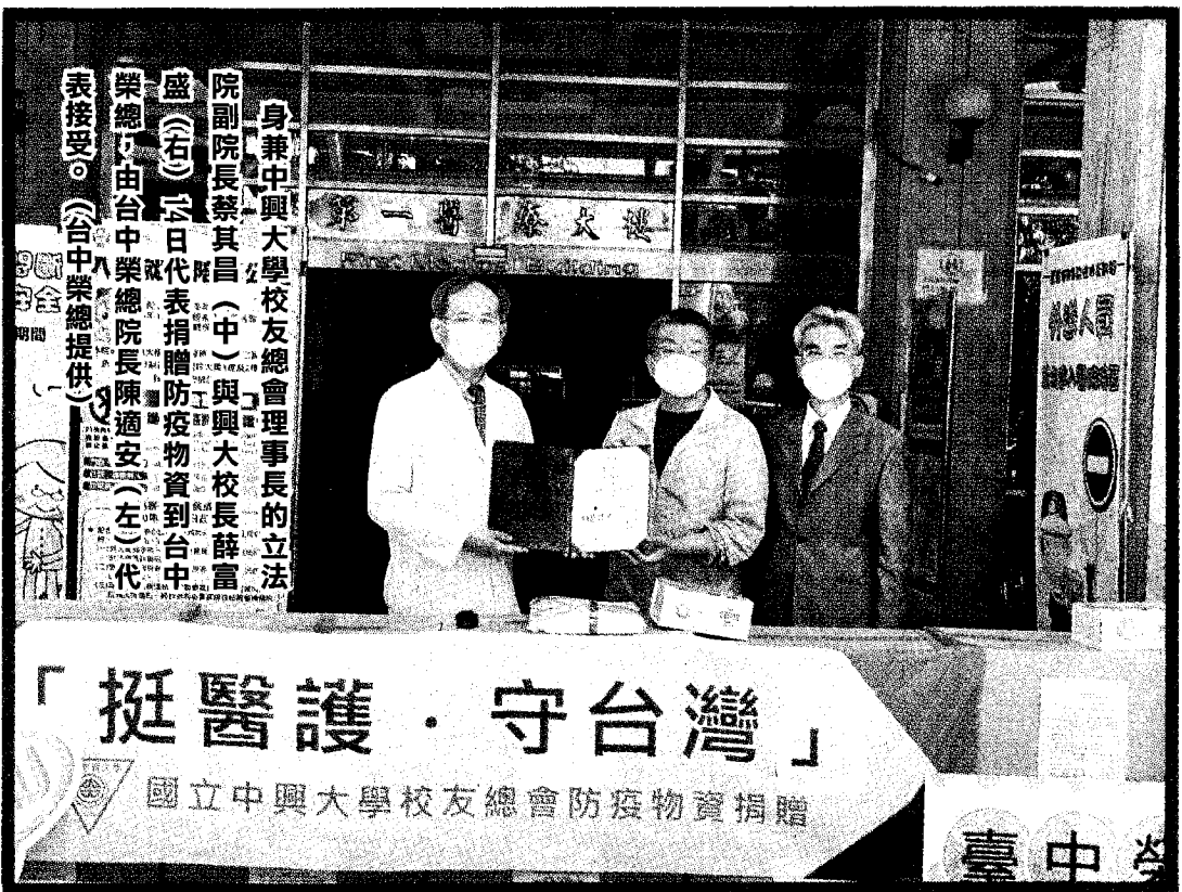
身兼中興大學校友總會理事長的立法院副院長蔡其昌(中)與興大校長薛富盛(右)昨日代表捐贈防疫物資到台中榮總，由台中榮總院長陳適安(左)代表接受。