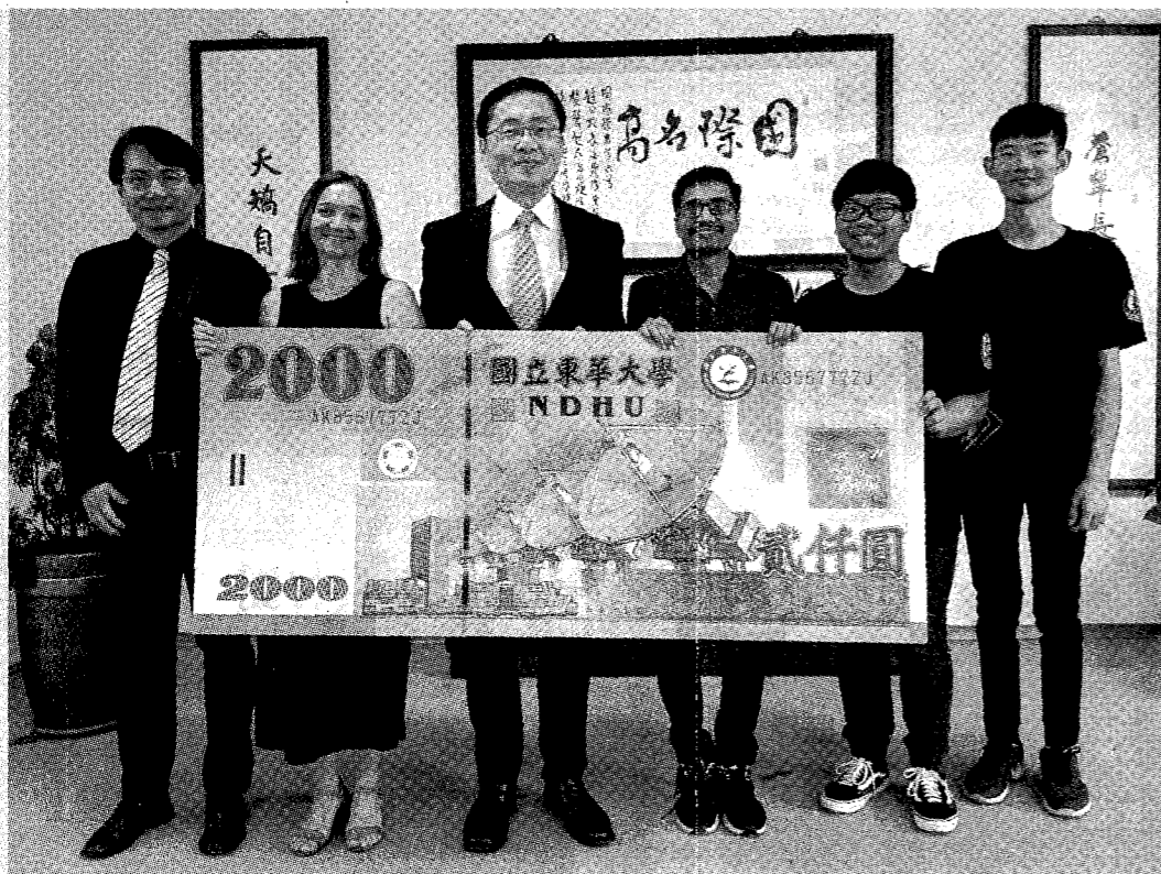
圖：東華大學教師會於教師社群發動境外生紓困募款，東華大學轉交募得款項給生活困頓的境外生。

趙涵捷校長心繫東華全體學生，對於本國生部份，東華大學也辦理「因應疫情影響，學生申請緊急紓困助學金及校外住宿租金補助」，自一一〇年五月一日起至一一〇年七月三十一日止，學生本人或家庭成員經濟確實受疫情影響者（學生本人或家庭主要經濟來源者，因疫情放無薪假、減少工時、非自願性離職（失業），致生活頓失收入，陷入困境，影響學生就學），皆得以申請。緊急紓困助學金分為三個方案，補助金額分別為六〇〇〇元、九〇〇〇元及一八〇〇〇元不等，相關辦法已於一一〇年六月十六日公布。