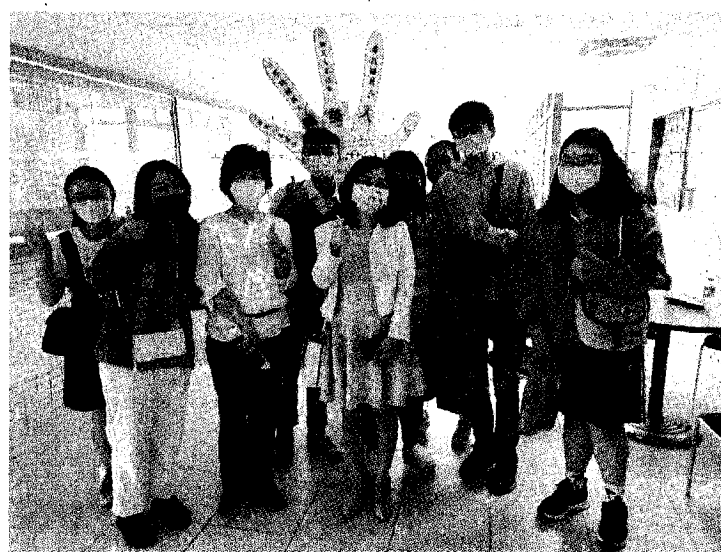
輔英科大校園開放日展現學系特色校長和說明志工合影。