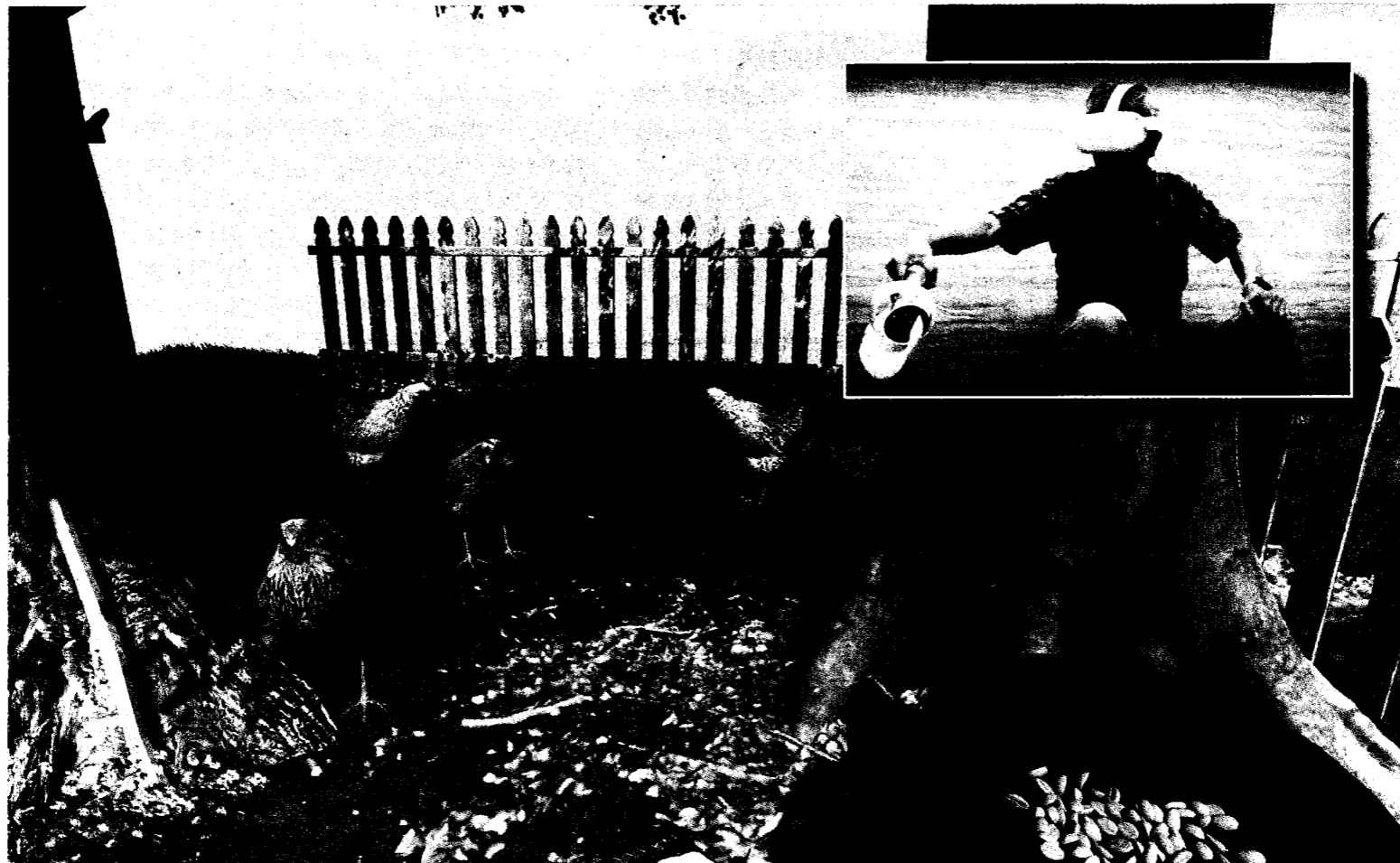
←使用者在VR頭盔，看到的情景。