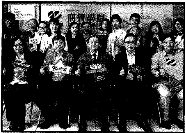
全國唯一通過世界級認證的私立科技大學，南臺科技大學連續通過AACSB國際商管教育認證！