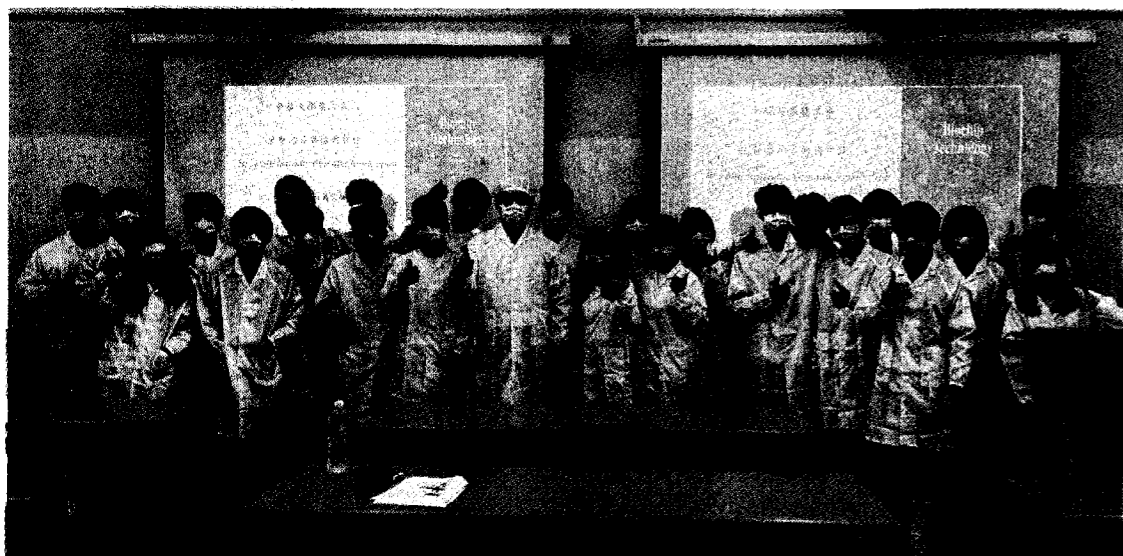
中原大學醫工系培養兼具工程技術與生物醫學知識的人才。

【本報記者任青莉台北報導】中原大學昨日表示，該校榮獲教育部「2022精準健康產業跨領域人才培育計畫」智慧醫材領域補助，中原醫工將擴大培育「智慧醫材」跨領域人才，每年可獲得補助，預計為期四年。