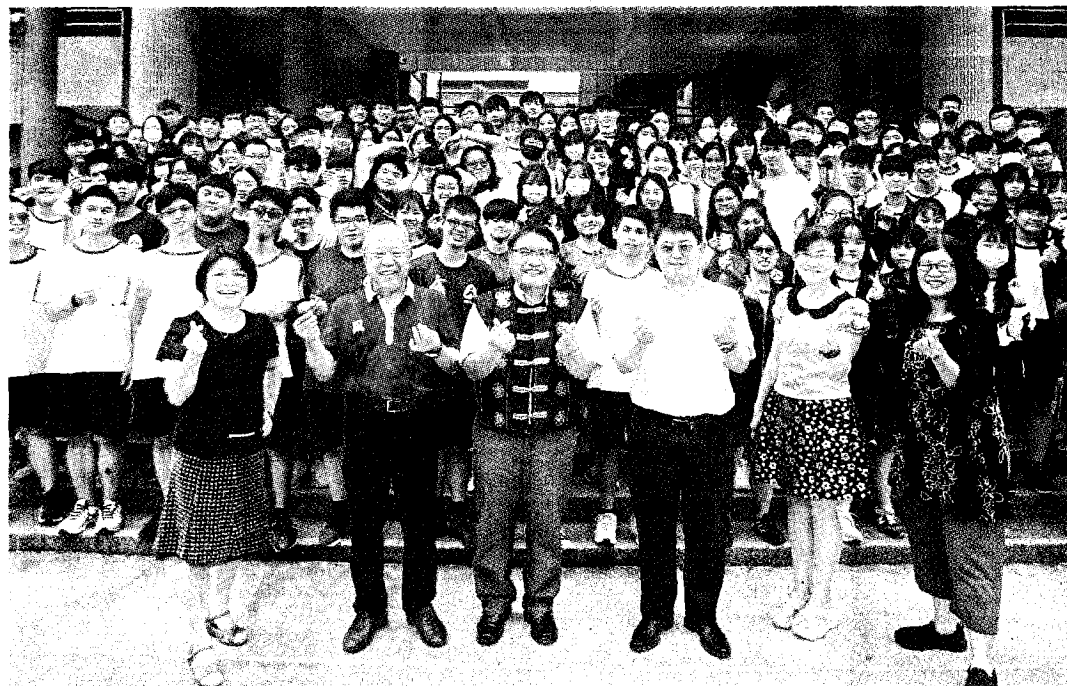
大學繁星昨天放榜，國立潮州高中錄取117人創新高，也再度榮登全台錄取最多的高中。自由時報A9版（記者陳彥廷攝）

〔記者吳柏軒／台北報導〕一一一學年首批大學繁星昨天放榜，許多新鮮人誕生！大學甄選會公布繁星推薦第一到七類錄取名單，約一·五萬人錄取，錄取率六十一·八一%；另有七十八個科系無人錄取，整體缺額九一九名，如台大也有七科系缺十五人創新高，研判與學測數學A及自然等科頂標人數過少有關。