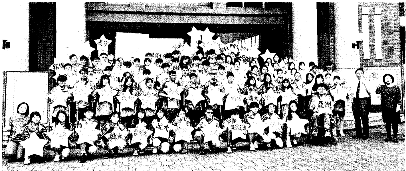
大學繁星推薦昨放榜，彰化溪湖高中特別將錄取的學生聚集合影，他們將不用再準備個人申請和分科測驗。