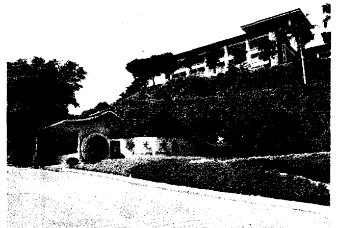
大學繁星推薦昨天放榜，佛光山南華大學和佛光大學表現亮眼。圖為佛光大學校園。

而為了加強學用合一能力，連年入選企業最愛畢業生的佛大，亦開高等教育先例，針對繁星入學學生首創「參與式學習」機制，藉此提升畢業即就業優勢。