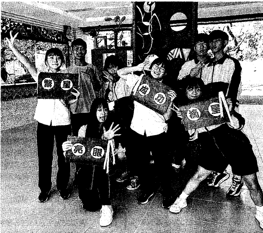
111學年度大學繁星推薦管道22日公告第1類至第7類學群錄取結果，六龜高中是高雄市唯一偏鄉市立高中，今年繁星共有8名同學上榜，文組藝術理工皆有。

共計739人，較去年減少51人。根據統計，通過醫學系一階篩選有330人、通過牙醫系一階篩選有73人。第8類學群考生，通過一階篩選者，還要再參加二階甄試，才能確定是否錄取。