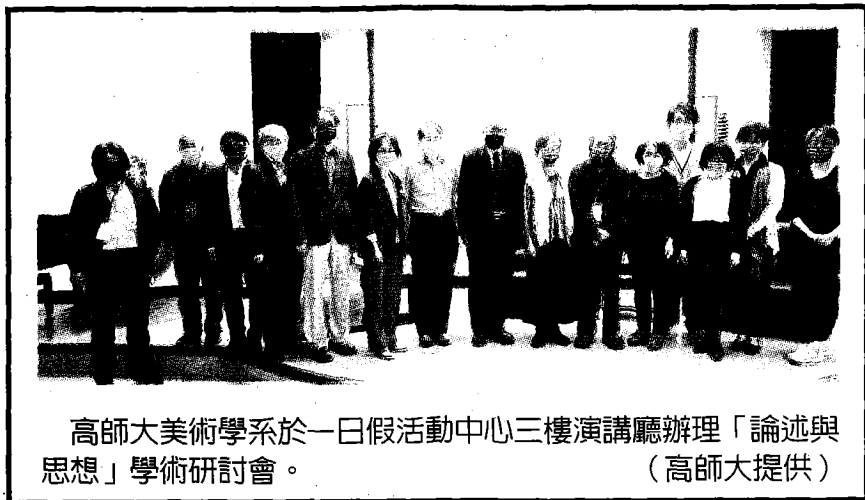
高師大美術學系於一日假活動中心三樓演講廳辦理「論述與思想」學術研討會。

〔記者黃福鎮高雄報導〕高師大美術學系於一日假活動中心三樓演講廳辦理「論述與思想」學術研討會，邀集國內藝術界菁英共聚一堂，共同研討高雄的生態發展，就過去史觀脈絡與當下藝術生態產業實況，規劃未來具發展方向。