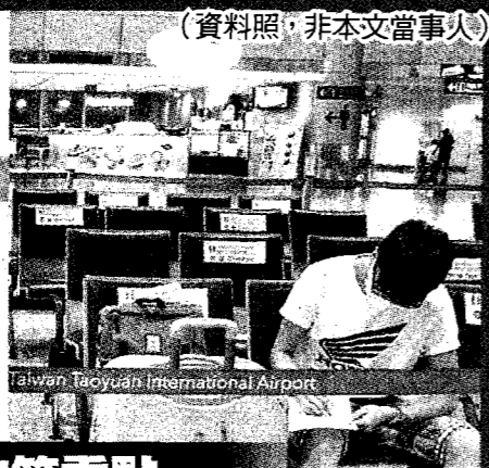
Taiwan Taoyuan International Airport