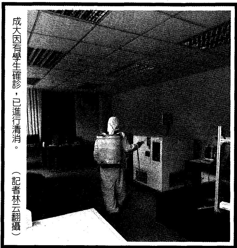
成大因有學生確診，已進行清消。