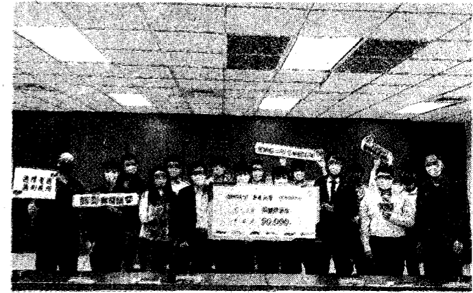
樹德科大獲贈「群創光電實習獎學金」。