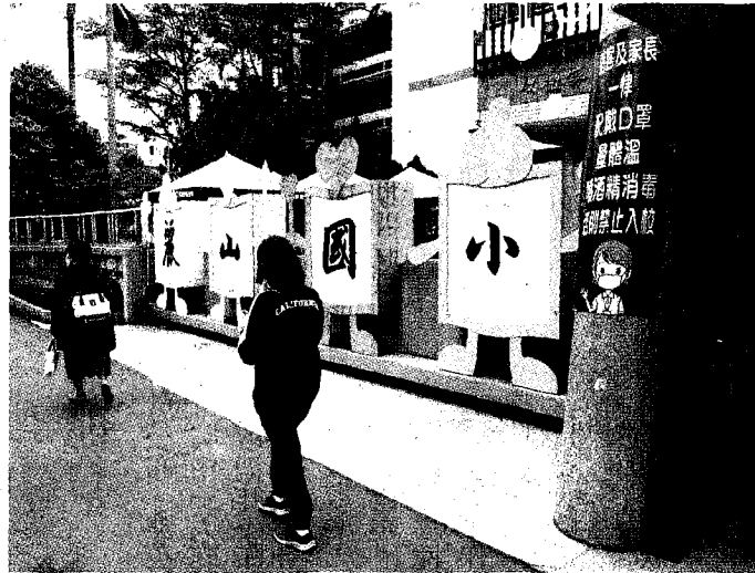
北市麗山國小因學生染疫，昨天停課。教育部長潘文忠昨在立院表示，下周將跟指揮中心研商，盼對停課標準做滾動修正。

【記者周志豪、吳亮賢、許維寧、鍾維軒／台北報導】教育部統計，國內學生昨再增四十九例確診，學生確診累計達一八七一人。全台累計已有十五縣市、一八一所校園停課。國民黨立委呂玉玲昨天質詢教育部長潘文忠，現行停課標準嚴苛是否研擬鬆綁，潘回應，「一定會朝這方向來進行」，下周跟指揮中心研商後，盼能對停課標準做滾動修正。