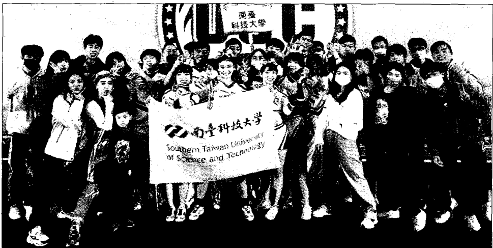
↑南台競技啦啦隊發揮合作默契，奪得海洋盃全國啦啦隊賽混合小組第一、二名，及畢業校友雙人組第一名。