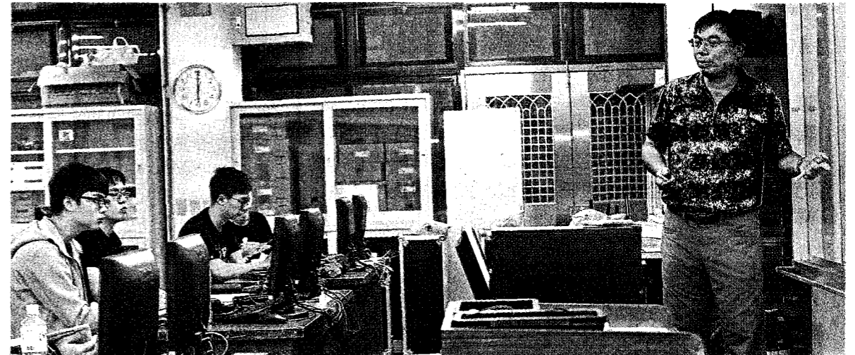
高教危機 少子化造成學生減少，但大專校院砍教師速度更快，導致生師比上升。圖為某科大教師上課情形。

全國私校工會理事長尤榮輝表示，學生數少了，許多學校財務困難，所以就減少聘任專任教師，進一步形成惡性循環。辦學成績不佳的大學，必須挾注資源聘更多好教師來改善教學品質，才有起死回生的機會。