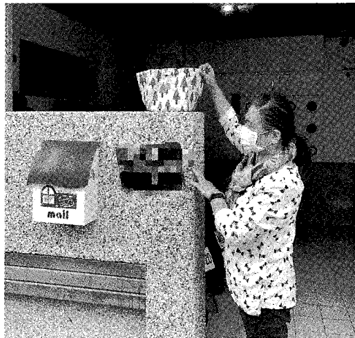
圖：全面關懷染疫學生，慈科大主動媒合遠距醫療，免費送餐至校外租屋處。