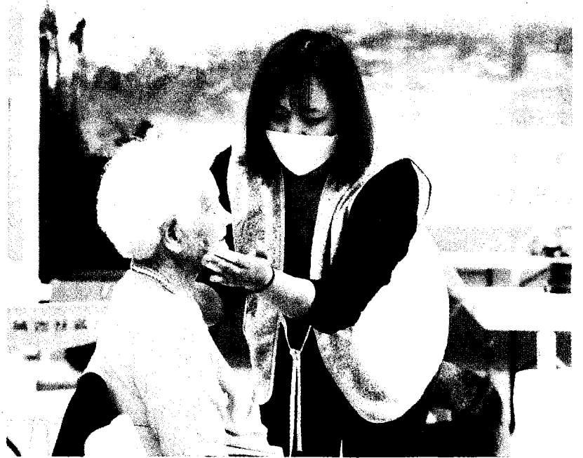
↑嘉藥環境永續學院及粧品系學生，為社區長輩化妝、設計婚紗造型，讓阿公、阿嬤再現當年結婚時的溫馨幸福。