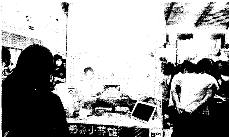
↑南台數位設計學院「疊代→映現」聯合畢業展，共計展出五系百餘件作品，藉由各系專屬主題呈現學生們四年來所累積實力及創造力。