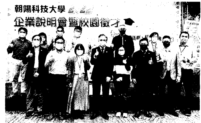
企業校園徵才與會貴賓合影。