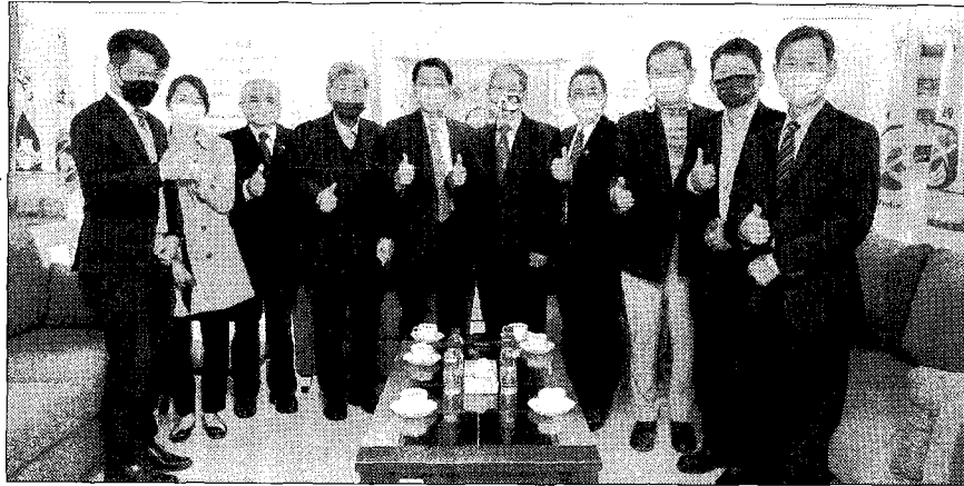
私校儲金管理會專題演講。