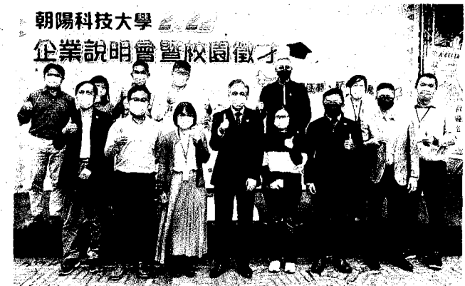
企業校園徵才與會貴賓合影。