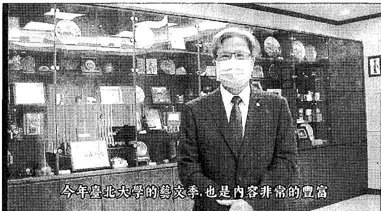
台灣新生報 9 版