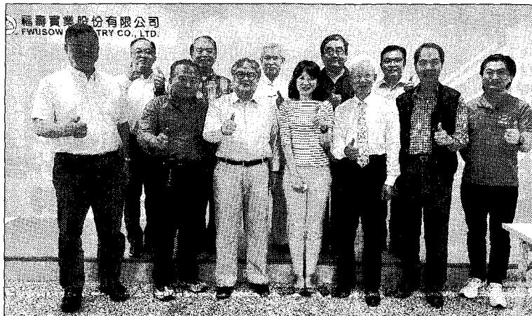
台中市真理大學校友會座談會（福壽實業形象館）。